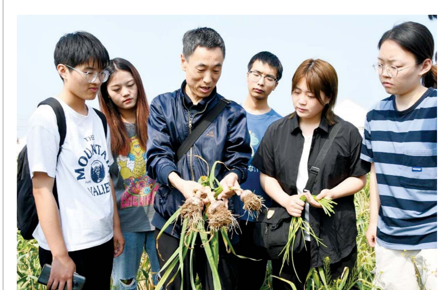
近日,在高青县山东福园农业科技有限公司孟荆陈村大蒜种植基地,采用山东理工大学新实验技术培育后,蒜薹能够提前收获2-7天,每亩增产近150斤,大蒜每亩增产700多斤。科技兴农让农民见到了效益、得到了实惠。在指导教师的带领下,由山东理工大学生命科学院学生组成的科技服务队,不断把新实验研究成果运用到田间地头,以实际行动助力乡村振兴。