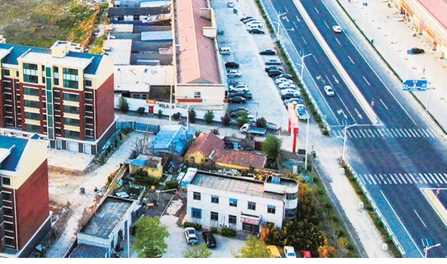
①厨具产业园区一期建设的皓睿厨具产业园