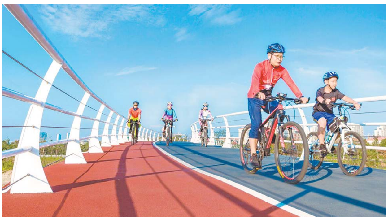
日照高标准打造28公里阳光海岸绿道和33.8公里山海风情绿道，成为市民、游客休闲健身的最美去处。