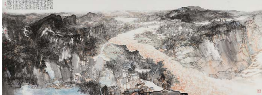
黄河与京杭大运河交汇 贾荣志 中国画