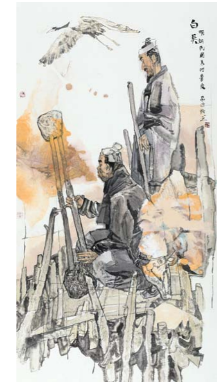
齐鲁治黄名人白英 岳海波 中国画