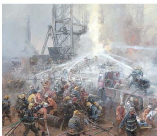
战井喷 杨克山 油画