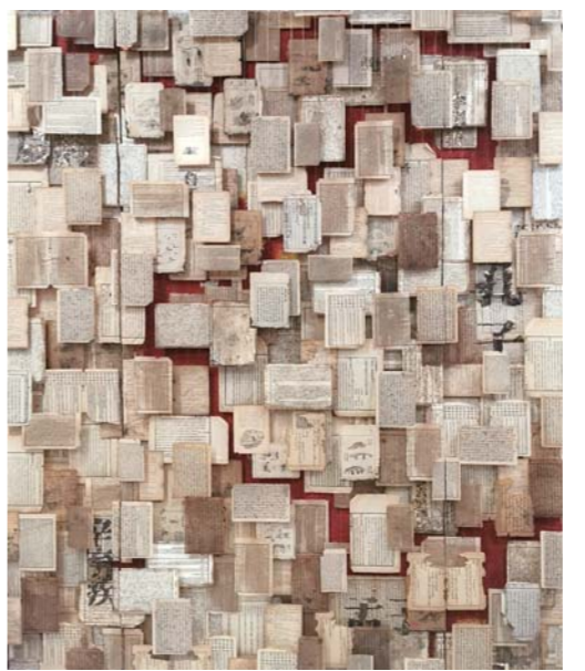
血脉 吴震 综合材料