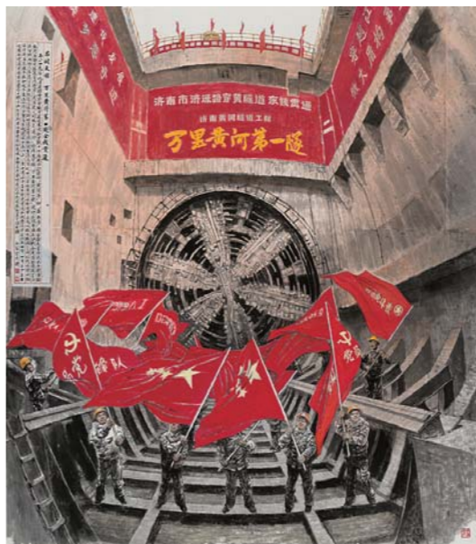
万里黄河第一隧 刘书军 中国画