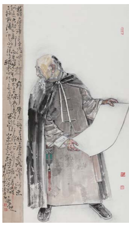
齐鲁治黄名人嵇璜 于新生 中国画