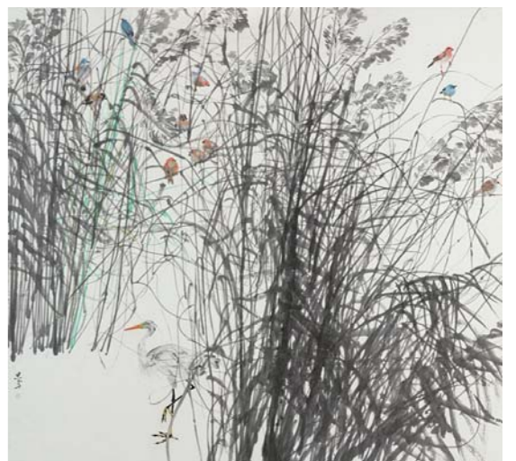
湿地生灵 李恩成 中国画