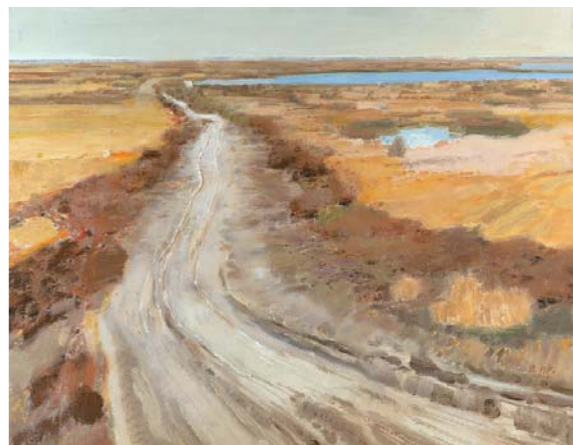
黄河古道 王力克 油画