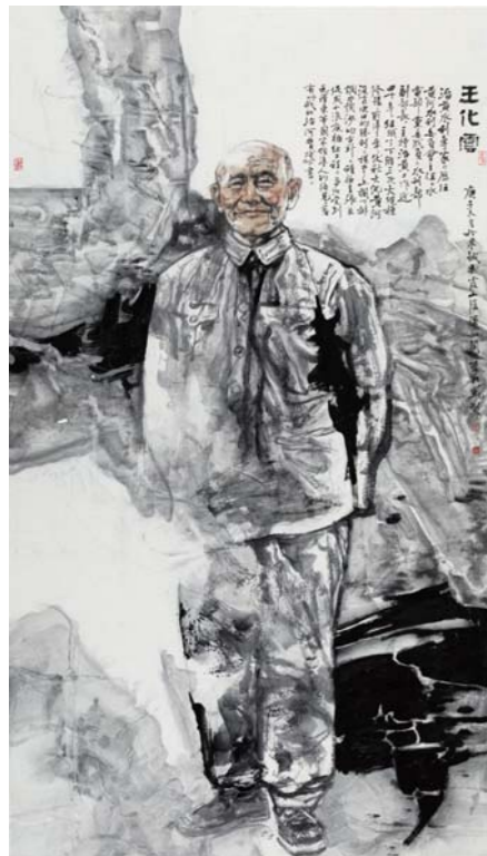
齐鲁治黄名人王化云 李兆虬 中国画