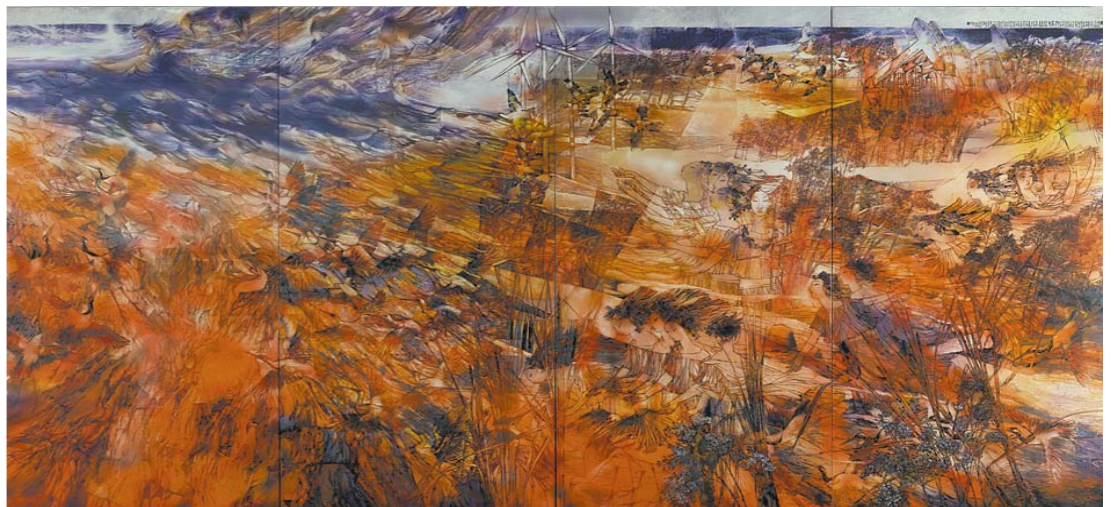
黄河入海流 宋丰光 张锦平 宋颀 中国画