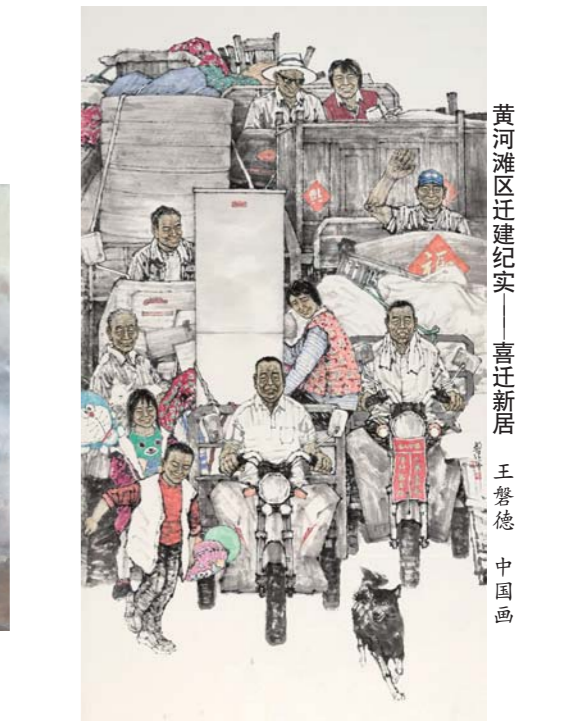
黄河滩区迁建纪实——喜迁新居 王磐德 中国画