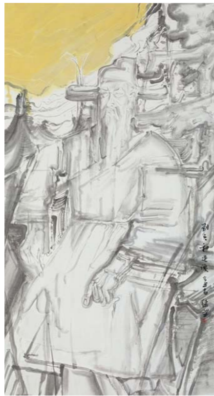
齐鲁治黄名人刘天和 张望 中国画