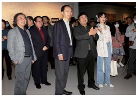
领导嘉宾参观展览