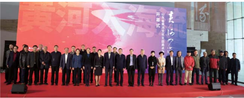
“黄河入海流——山东省黄河文化主题美术作品展”4月24日在山东美术馆开幕