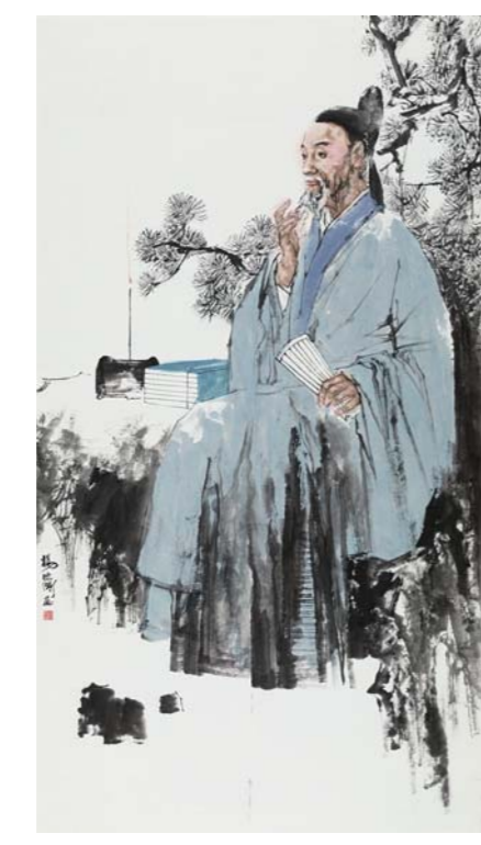
齐鲁治黄名人刘晏 杨晓刚 中国画