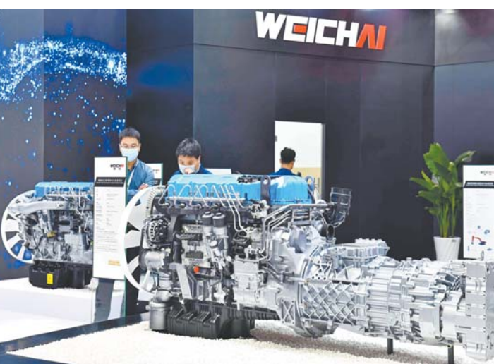
□文/记者 赵洪杰 报道