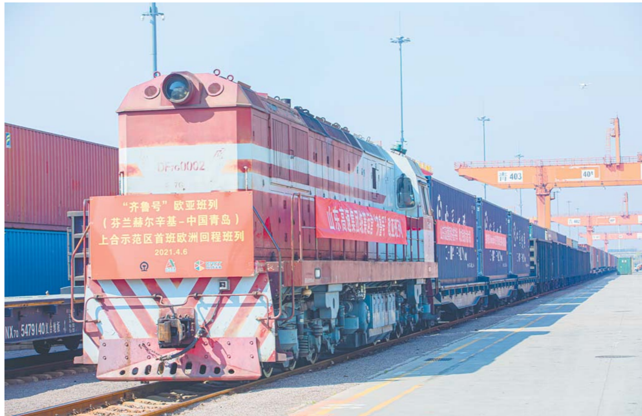
4月6日，“齐鲁号”欧亚班列首班芬兰回程班列顺利抵达上合示范区青岛多式联运中心。

此外，“齐鲁号”欧亚班列重点服务省内大型进出口企业，稳定开行供应链班列，今年已累计为海尔、海信、山东临工等企业开行定制化班列21列，同比增长90.9%。