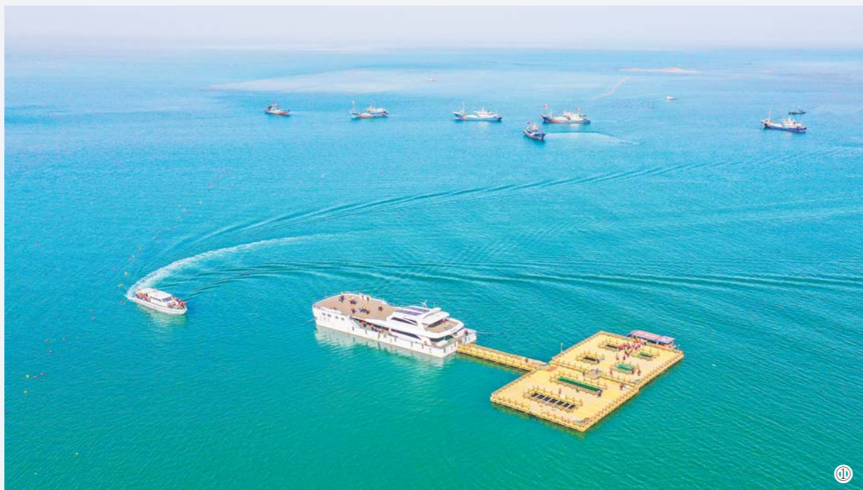
图①：东楸岛海洋牧场的海上观光平台。 图②：3月22日，游客在东楸岛海洋牧场观光平台上体验收海带。 图③：3月22日，东楸岛村内的海草房迎来大批观光游客。

3月22日，在荣成石岛管理区东楸岛海洋牧场的海上观光平台上，700名来自济南的游客采摘贝类、海上垂钓，尽情享受耕海牧渔的无穷魅力。随着气温回暖，荣成各大海洋牧场的海上观光平台陆续恢复营业。 近年来，荣成大力建设海洋牧场，全面推进渔业转型升级，目前已培植国家级海洋牧场示范区10家、省级海洋牧场17家，培植省级休闲海钓场15个。当地还充分利用百年海草房，开展海上平台游、住民宿、品渔家宴为中心的旅游品牌建设，吸引了越来越多国内外游客的到来，成为全国百佳乡村旅游目的地。