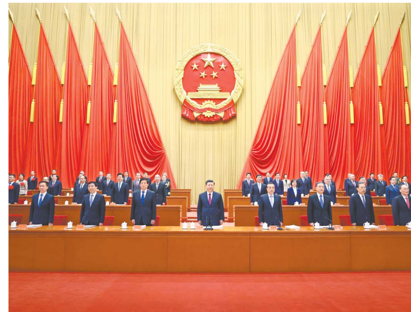
2月25日，全国脱贫攻坚总结表彰大会在北京人民大会堂隆重举行。习近平、李克强、栗战书、汪洋、王沪宁、赵乐际、韩正、王岐山等出席大会。