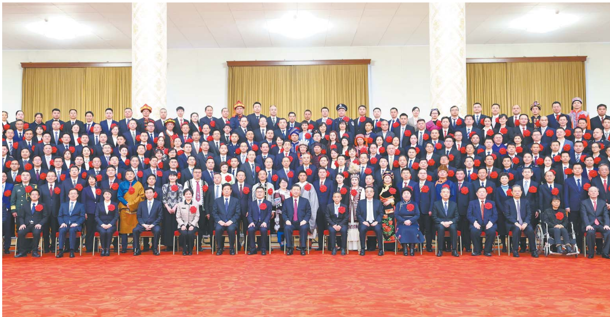
2月25日，全国脱贫攻坚总结表彰大会在北京人民大会堂隆重举行。会前，习近平等会见全国脱贫攻坚楷模荣誉称号获得者，全国脱贫攻坚先进个人、先进集体代表，全国脱贫攻坚楷模荣誉称号个人获得者和功勋人物、全国脱贫攻坚先进个人亲属代表等，并用大家合影留念。