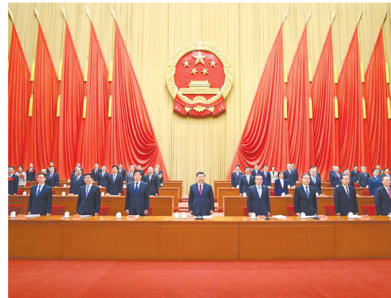
2月25日，全国脱贫攻坚总结表彰大会在北京人民大会堂隆重举行。习近平、李克强、栗战书、汪洋、王沪宁、赵乐际、韩正、王岐山等出席大会。