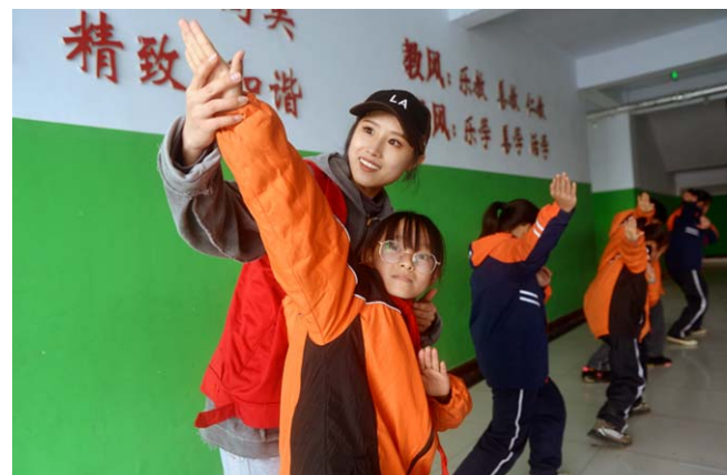
在西小王镇中心小学校教学楼大厅里,年轻的志愿者教孩子们跳起欢快的街舞。