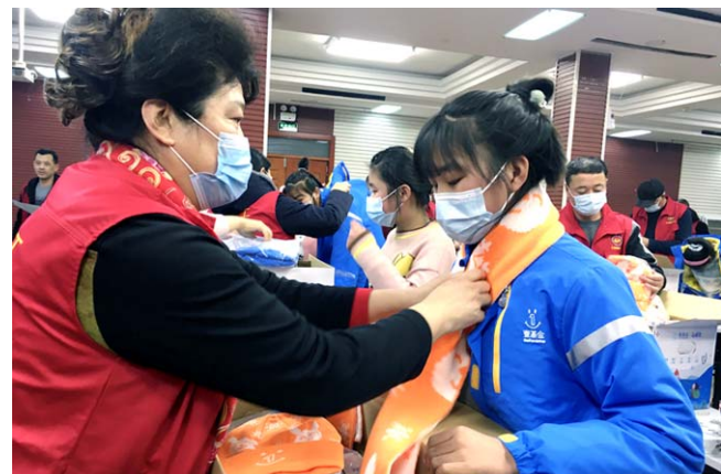
志愿者将包括全套冬衣在内的“温暖包”送到帮扶儿童的手中。