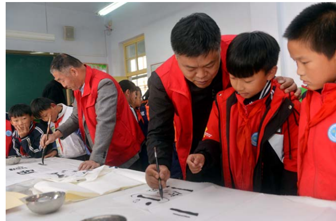
书法志愿者耐心细致地教学生写毛笔字,体验提按使转的书写乐趣。