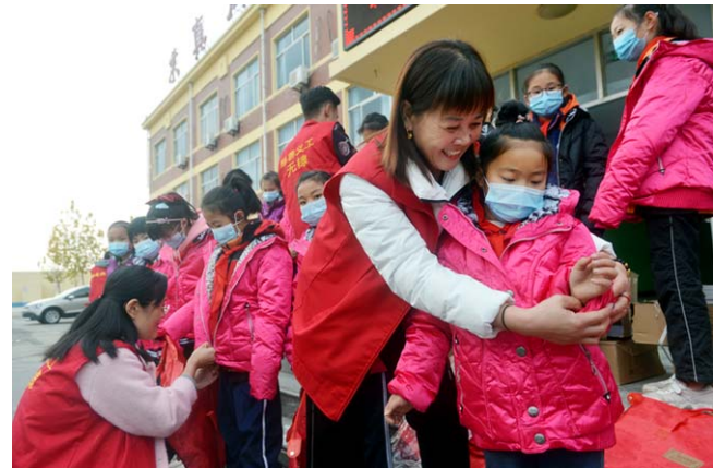
无棣县慈善义工协会的志愿者为该县西小王镇中心小学校的学生穿上捐赠的羽绒服。

入冬以来,无棣县慈善义工协会志愿者,联合无棣县博爱社工、无棣县舞蹈协会、书法家协会等组织,举行了一系列为乡村儿童送温暖的活动。1月10日,他们举行的“壹基金温暖包”送达活动,将包括全套冬衣在内的“温暖包”送到41名帮扶儿童手中。