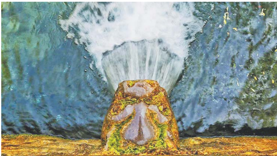
泉水喷涌而出(资料图)

有人说,黑虎泉的泉水来自泰山上的黑龙潭。黑龙潭与东海有暗河相通,乃是东海龙宫的一个秘密出口,里面住着一黑一白两条龙。一旦出来,必将山崩地裂,海水倒灌齐鲁大地。