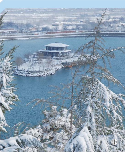
① 济平干渠 ② 引黄济青泥沙出口闸 ③ 生态沂河 ④ 滨州市嘉业生态清洁小流域