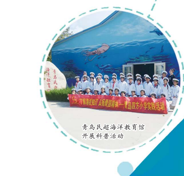
青岛民超海洋教育馆开展科普活动