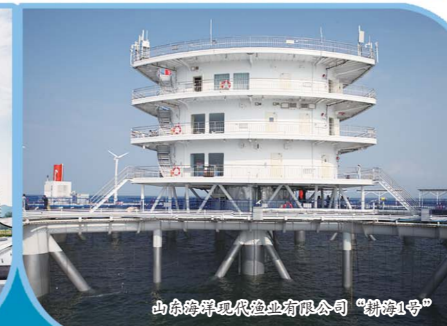
山东海洋现代渔业有限公司“耕海1号”