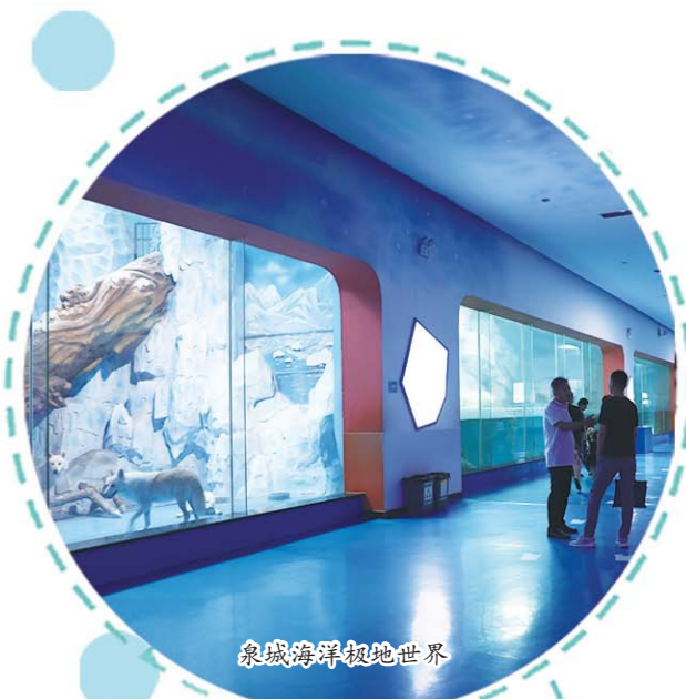
泉城海洋极地世界

位于滨州市海洋发展和渔业局一楼大厅。展区总面积1500余平方米，分滨州海洋成就、模拟生态用海、海洋生物标本、海洋摄影模型、4D电化宣教、海域数字沙盘、海洋书画作品和海洋文化长廊等8个展区。展示内容丰富，手段多样，能满足不同层次人群的海洋求知需求。