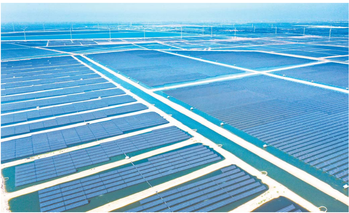
夏津县深化水利体制改革，将单一机构管理改为管区管理，实施标准化管理、合理分工，破解基层水管难题；临沭县建立“从源头到龙头”城乡一体化供水体系，实施“农村供水价格与城市同源同质不同价”的优惠政策，保障农村地区用水安全。

济南空天信息产业制定了“1234”工作目标，即创办1所大学，建设2所研究院，培育3家上市公司，打造4个特色园区，力争用3-5年的时间形成千亿级产业规模，成为带动经济社会发展的高地。随着齐鲁研究院、卫星应用等一批合作项目相继落户，省会千亿级空天信息产业发展格局已初具雏形，填补了山东在卫星和空天信息产业的空白。