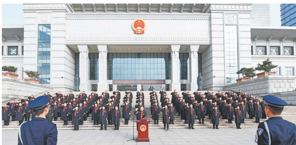
山东省高级人民法院大楼前，员额法官向宪法宣誓。(□张依盟 韩国健 报道)

“传染病疫情期间，到同一医疗卫生机构收集、运送医疗废物的间隔时间不得超过二十四小时”，“对传染病疫情期间违反医疗