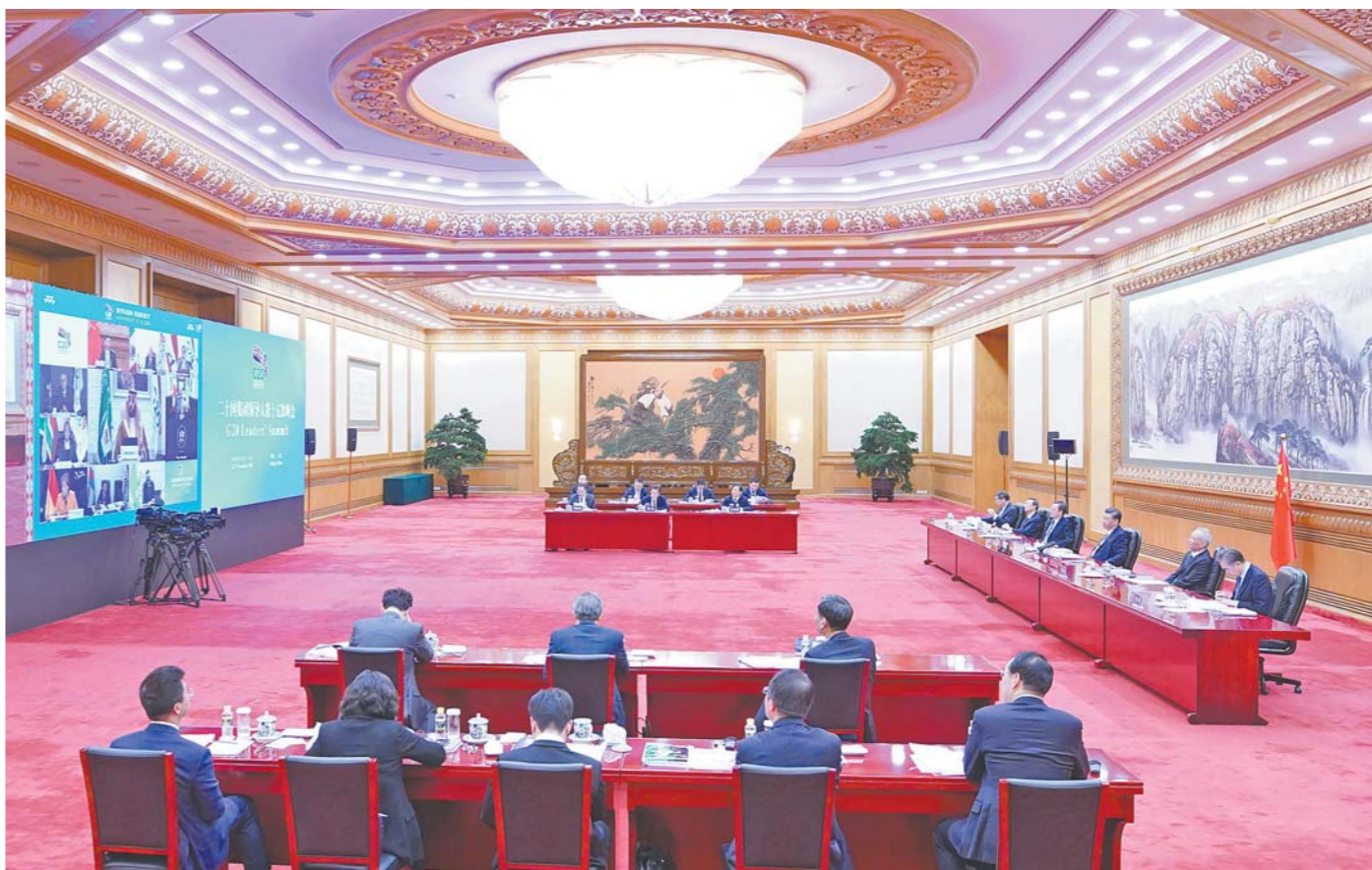
11月21日晚,国家主席习近平在北京以视频方式出席二十国集团领导人第十五次峰会第一阶段会议并发表重要讲话。

新华社北京11月21日电 国家主席习近平21日晚在北京以视频方式出席二十国集团领导人第十五次峰会第一阶段会议并发表题为《勠力战疫 共创未来》的重要讲话,强调二十国集团应该遵循共商共建共享原则,坚持多边主义、开放包容、互利合作、与时俱进,在后疫情时代国际秩序和全球治理方面发挥更大引领作用。中国愿同各国相互尊重、平等互利、和平共处、共同发展,共同推动构建人类命运共同体。