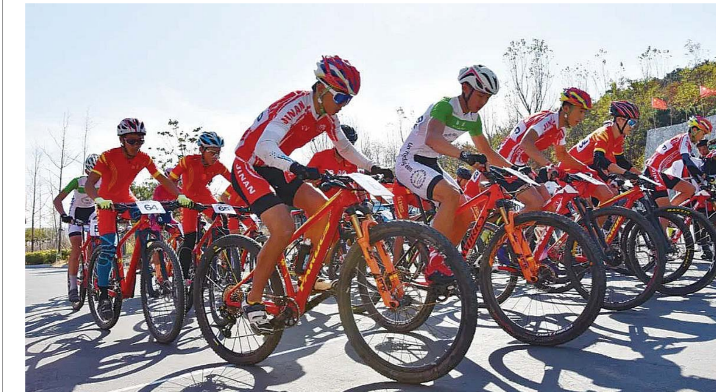
11月6日至10日，2020年“中国体育彩票杯”山东省青少年山地自行车冠军赛在日照市山海天旅游度假区驻龙山自行车主题公园开赛。本次比赛由山东省射击自行车运动管理中心主办，日照市体育局承办。作为我省2020年青少年自行车冠军赛的第二个竞赛项目，山地自行车冠军赛共有来自省内8个市的78名运动员、教练员参赛。

据悉，2016年以来，东港区共开工建设安置楼房54849套，其中15265套货币化项目实现即时安置，共建设实物安置楼房39584套，建筑面积约751万平方米。今年，将全力以赴保障城中村改造安置区的优质快速建设，确保10个安置区、9556套安置楼房竣工交付使用。