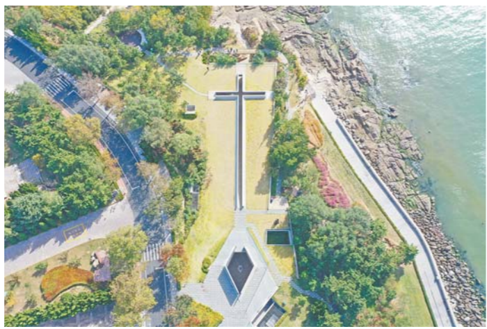
上图：华工日记 下图：俯瞰威海一战华工纪念馆

土与光面清水混凝土相结合，寓意华人劳工在战争中饱受苦难；水泥象征凝重的历史，老船木承载沉寂的功绩，锈钢铁寓意剥落的真相。馆内中庭还放置了“种子”艺术雕塑，寓意新生及华工精神的传承与颂扬。