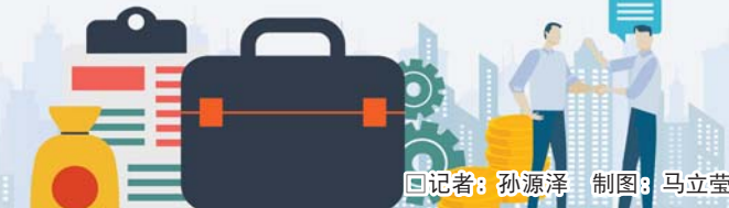
□记者：孙源泽 制图：马立莹