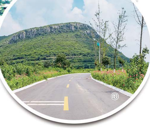
③沂水县三年集中攻坚建设的曹姚路