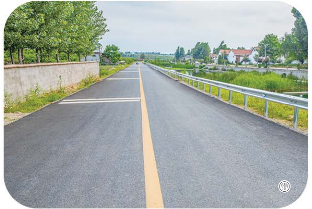
④沂南县农村公路成为美丽乡村

金秋时节，走进院东头镇西墙峪村，石板和灰砖路穿村入户，古朴的村居民宿错落有致，苍翠的树木和娇艳的花朵相映成趣。四面八方的游客纷至沓来，流连忘返。路通了，人气旺了，这个昔日的抗战堡垒村重新焕发了生机。