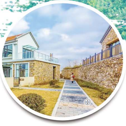
①沂南县农村公路成为美丽乡村