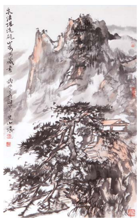
泉清山秀 刘晓阳 69cm x 45cm

为庆贺大众报业集团成立20周年，由大众报业集团主办，山东新闻书画院、齐鲁美术馆承办的一系列美术活动自9月28日起拉开了帷幕。继“共绘新时代 丹青谱华章”庆贺大众报业集团成立20周年全国美术学院院长暨鲁籍名家邀请展、“七彩锦华”驻济高校教师油画邀请展、“与时代同行 大众报业廿载风华”职工书画摄影展举办之后，“岁月秣华·山东优秀中青年国画名家十人展”今日在齐鲁美术馆开幕。从10位画家的作品中可以看出他们对艺术语言、艺术表现风格的探索，在个人情愫与生活体悟方面的融合，以及他们对中国传统文化与西方新思潮的吸收与包容。作品既有传统艺术的精华，又有当代艺术的新式样，展现了当代山东中青年画家旺盛的创造力与蓬勃的生命力。 ——编者