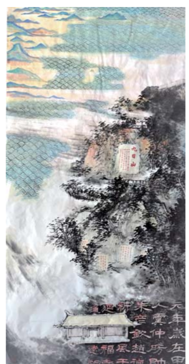
九日山怀古 孙文韬 138cm x 69cm