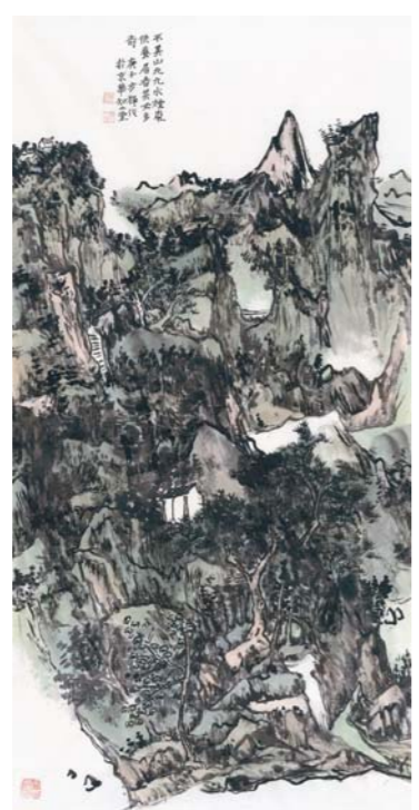
不其山北九水 方辉 138cm x 68cm