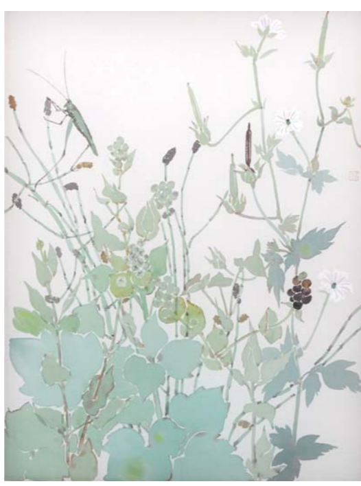
微光 李思成 43cm x 32cm