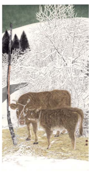
暖冬 刘扬 180cm x 97cm