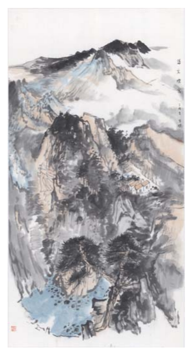
岱宗烟云 杨恩国 138cm x 69cm