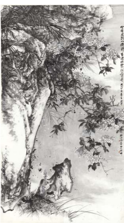
空谷风轻 韩斌 245cm x 128cm