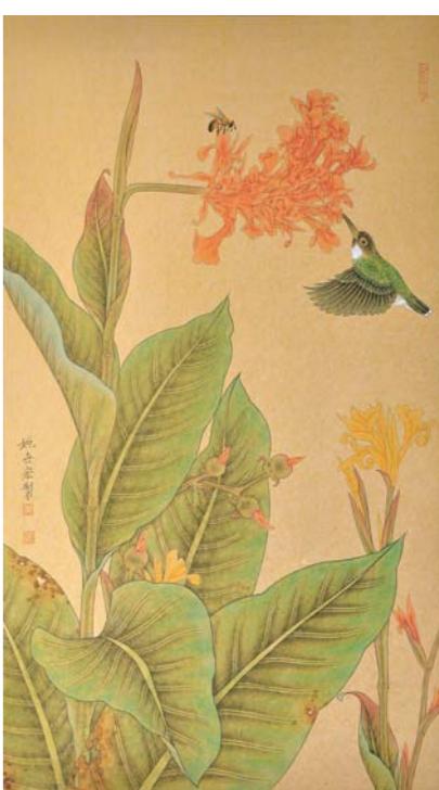
潇洒绿衣长 姚世宏 70cm x 40cm

主办单位: 大众报业集团 承办单位: 齐鲁美术馆、山东新闻书画院 参展画家: 刘晓阳、李思成、杨恩国、刘扬、吴疆、方辉、韩斌、陈凯、孙文韬、姚世宏 展览时间: 2020年10月16日—26日 展览地点: 齐鲁美术馆(济南市高新区舜风路101号齐鲁文化创意基地)