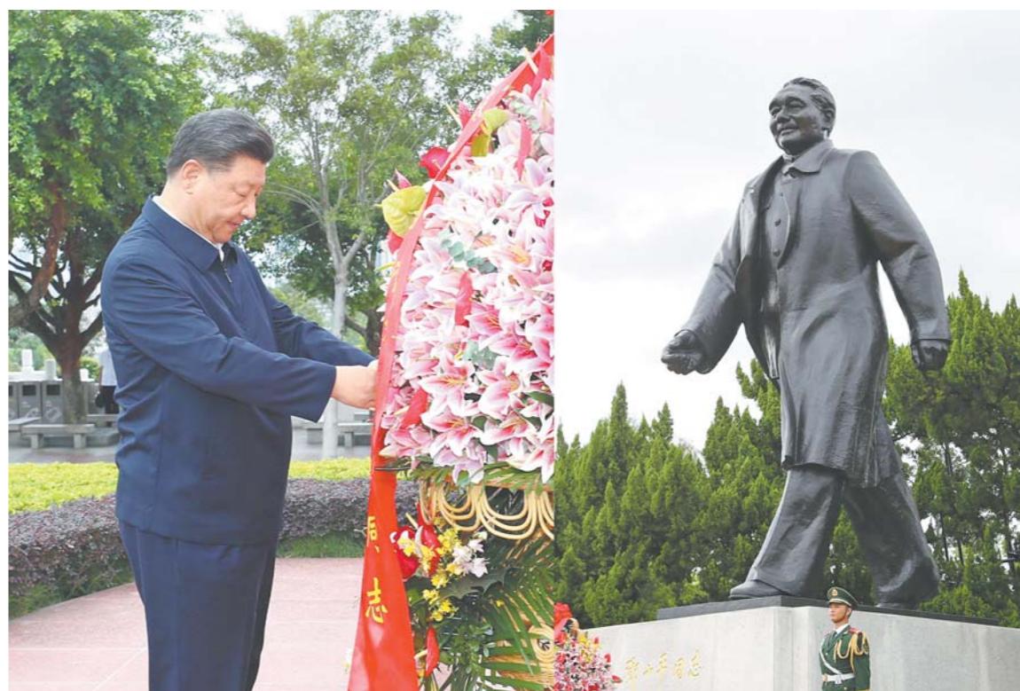
十月十四日,深圳经济特区建立四十周年庆祝大会在广东省深圳市隆重举行。中共中央总书记、国家主席、中央军委主席习近平在会上发表重要讲话。这是当天下午,习近平来到莲花山公园,向邓小平同志铜像敬献花篮。

新华社深圳10月14日电 深圳经济特区建立40周年庆祝大会14日上午在广东省深圳市隆重举行。中共中央总书记、国家主席、中央军委主席习近平在会上发表重要讲话强调,要高举中国特色社会主义伟大旗帜,统筹推进“五位一体”总体布局,协调推进“四个全面”战略布局,从我国进入新发展阶段大局出发,落实新发展理念,紧扣推动高质量发展、构建新发展格局,以一往无前的奋斗姿态、风雨无阻的精神状态,改革不停顿,开放不止步,在更高起点上推进改革开放,推动经济特区工作开创新局面,为全面建设社会主义现代化国家、实现第二个百年奋斗目标作出新的更大的贡献。