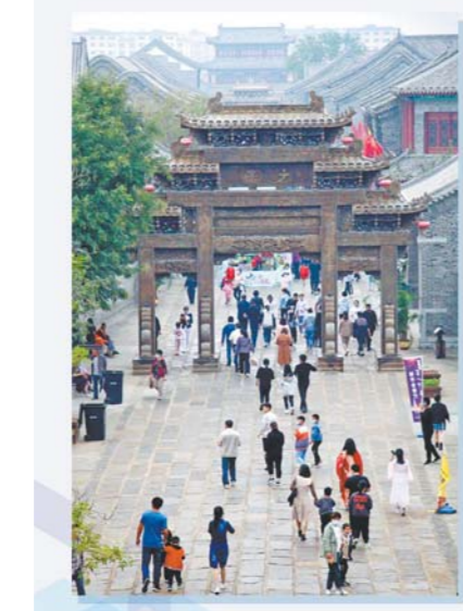
左：10月1日，游客在芜莱县古城景区观光。

假日前七天，全省持证住宿人数达到373.4万人次，达到去年同期的82.6%；全省三大移动电话运营商监测的市外手机漫游省内各市并驻留超过6小时的用户6709.9万人次。有数据显示，年轻人成为最积极的出游群