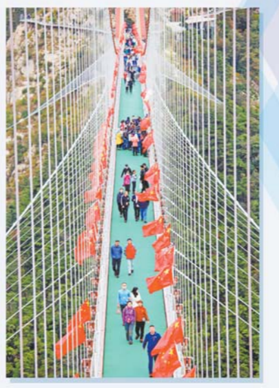
右：10月5日，游客在沂蒙山银座天蒙旅游区游览。

体，中青年成为黄金周出游主力军，占比53.6%，排名第一。据了解，假日旅游市场热度升温，乡村游、夜间休闲游、家庭亲子游等新业态备受游客青睐，精品民宿需求旺盛。