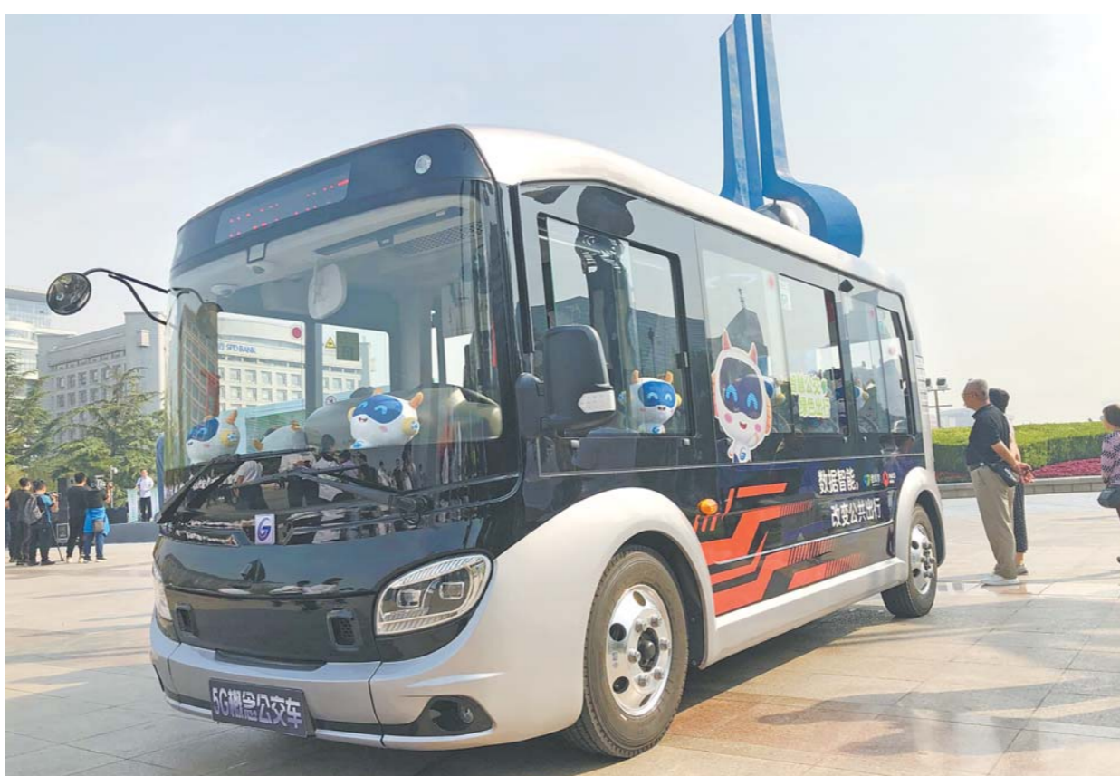
9月21日,5G概念公交车亮相济南泉城广场。(□记者 王健 报道)

5G概念公交车是聚集5G通信技术、边缘计算、车载以太网通信技术以及AI人工智能等最新技术的终端联动概念车,打通了GPS、视频等信息传输高速连接通道,实现了与公交数据大脑的直连互通。5G概念公交车运用了人脸识别无感支付系统,乘客通过“刷脸”快速完成登乘,车辆内置5G-Wifi模块,将5G信号转为车厢Wifi,乘客可通过出行APP入口直接连接高速网络。