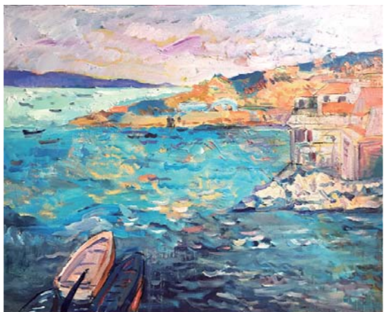
油画 巴塞罗那的海湾 王文瀚