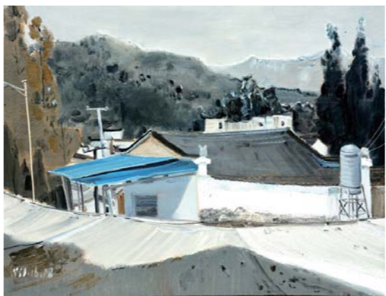
油画 江湾夏日 杨三军