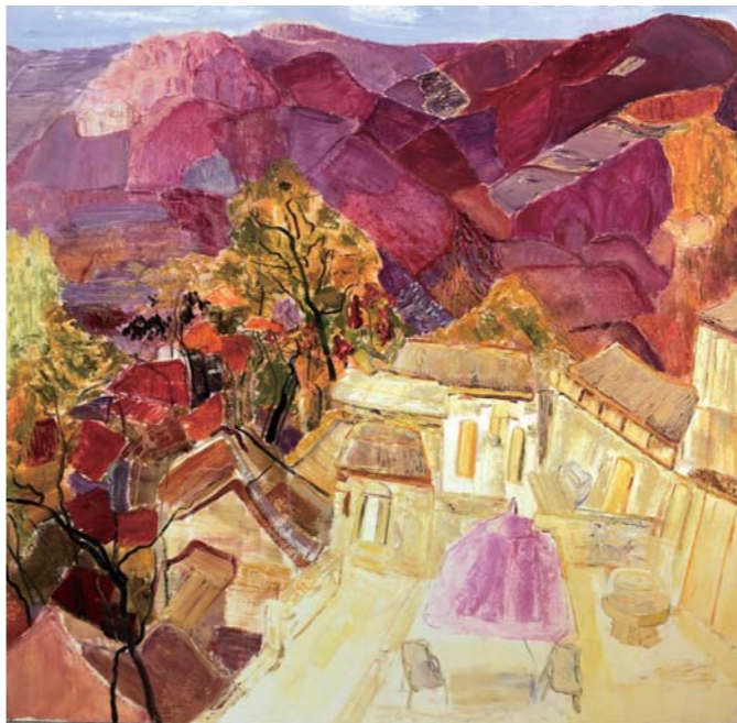
油画 时养山居 蓝峰