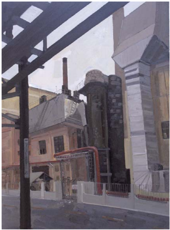
油画 痕迹二 张旭