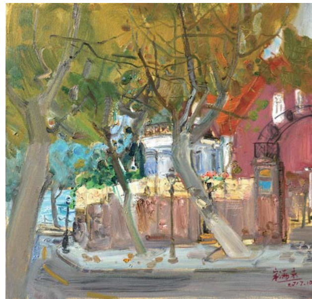
油画 蝴蝶楼 宋海永