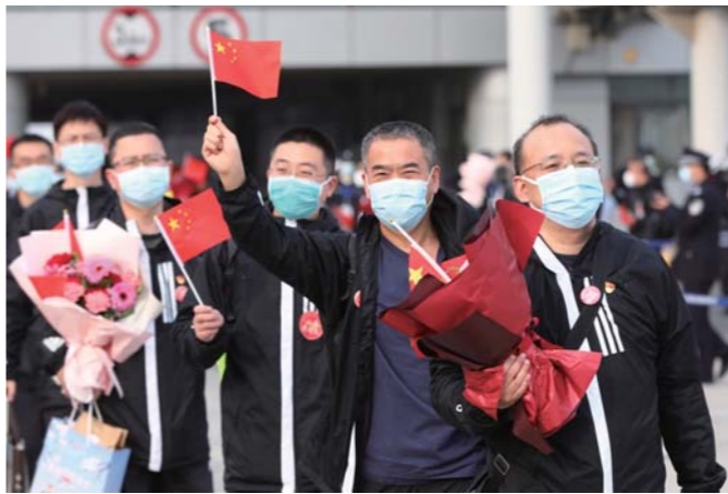
胜利归来