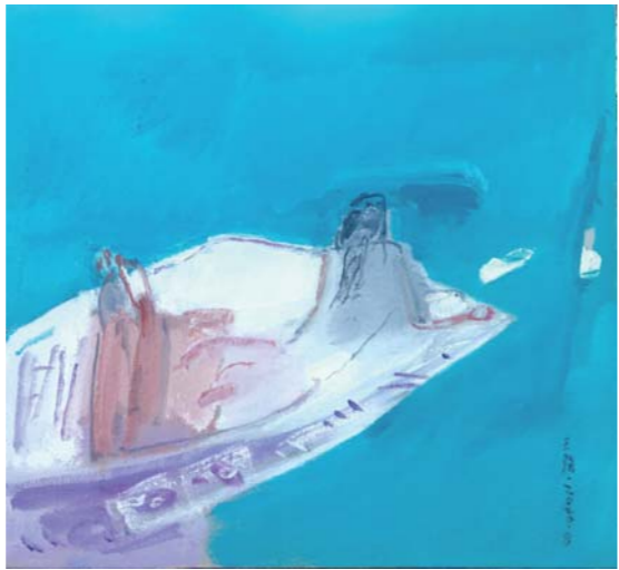
油画 人体写生 陈天强