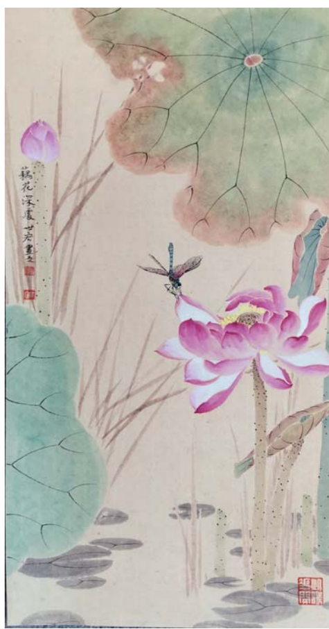
国画 藕花深处 姚世宏