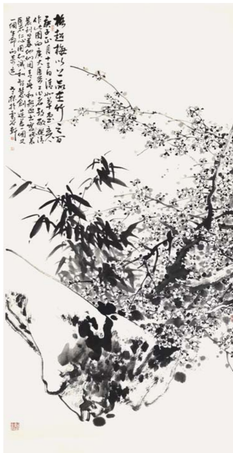
国画 格超梅以上 品在竹之间 田根承