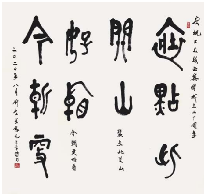
书法 装点此关山 今朝更好看 刘广东