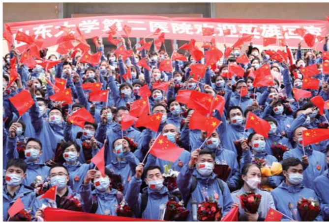
摄影 英雄凯旋 卢鹏