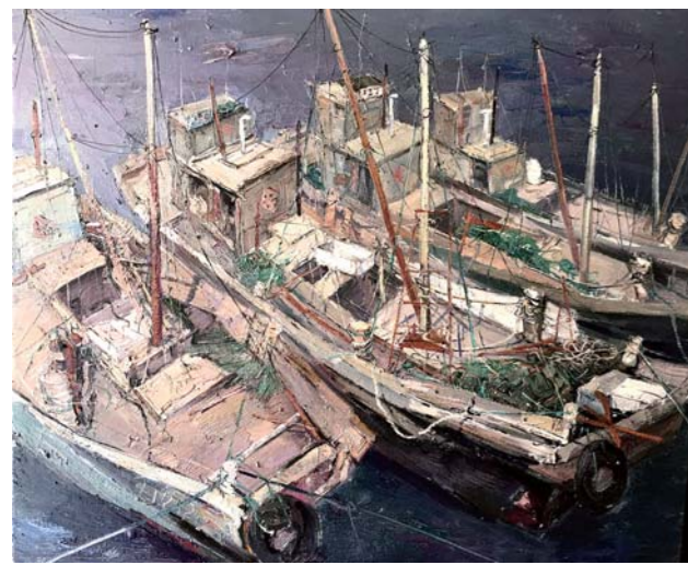
油画 渔歌之四 刘宁