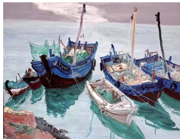
油画 荣成写生 宋卫东