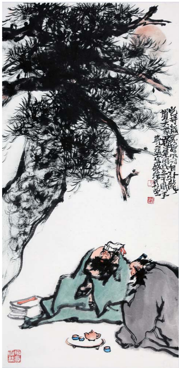
岂特岁寒操 明时有卧龙 张宜 136cm × 68cm