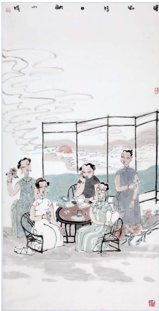
暖风晴日融 王小晖 136cm × 68cm