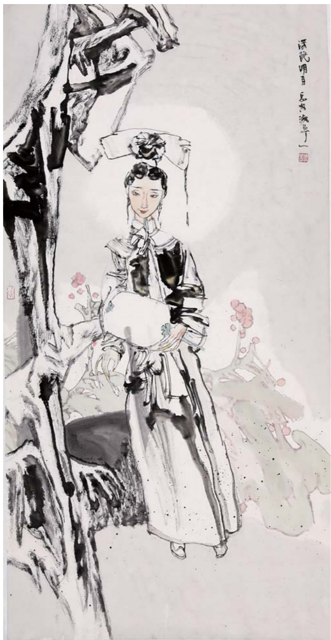
深院明月 岳海波 136cm × 68cm