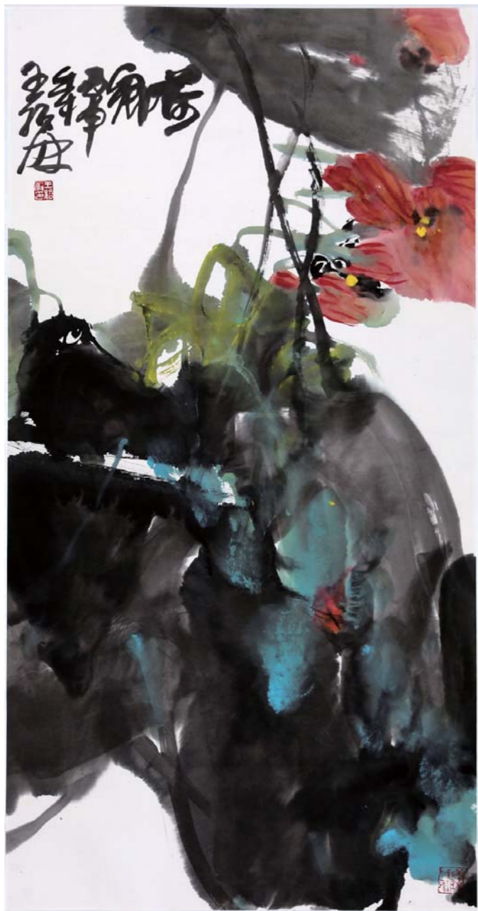
荷乡 王绍波 136cm × 68cm