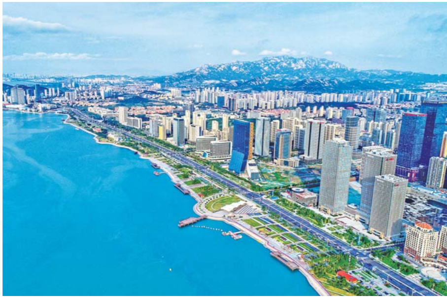
向上海学什么?青岛开宗明义:现代服务业。图为近年来,正在快速发展的青岛西海岸新区。

争此大任,青岛有着“舍我其谁”的自我认知与担当:新发展格局下,上海和青岛所承担的角色,可谓“君在长江首,我在黄河头”——上海毫无疑问是长江流域开放的“窗口”,而黄河流域乃是中国北方,尚缺乏能引领开放的城市。作为山东半岛城市群龙头,青岛主动发挥在新发展格局中连接南北、贯通东西的“双节点”价值,借力上海现代服务业,建设推