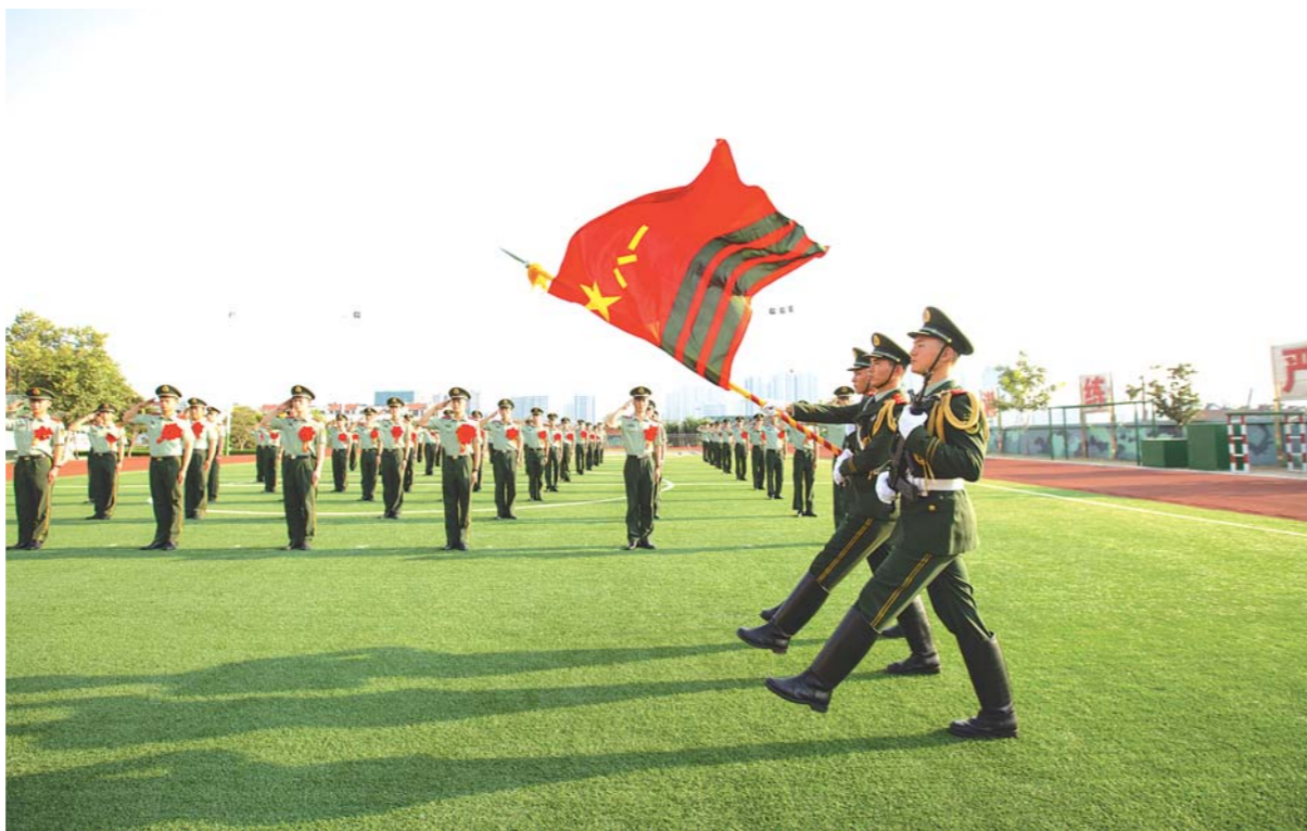
□ 刘涛 李飞跃 孟凡希 报道 8月31日下午，武警泰安支队举行退伍老兵向武警部队告别仪式。随着退役命令的宣布，支队66名夏秋季满服役期士兵光荣退出现役，开始了新征程。

据了解，后方企业已累计采购销售农副产品1200余吨，金额达1400余万元，成为了岳普湖农副产品销售的重要渠道。