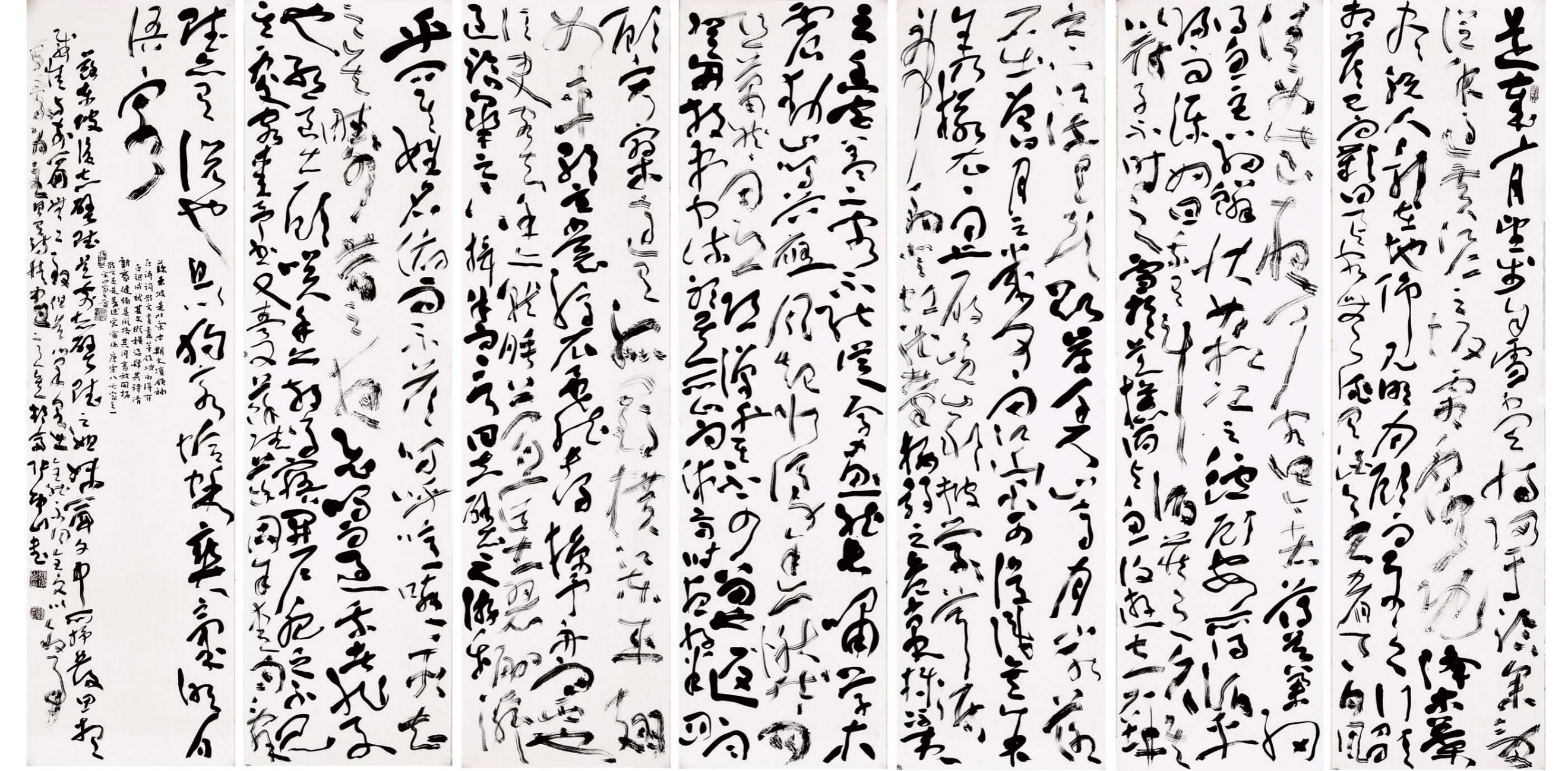
后赤壁赋 180cm×45cm×7 2018年