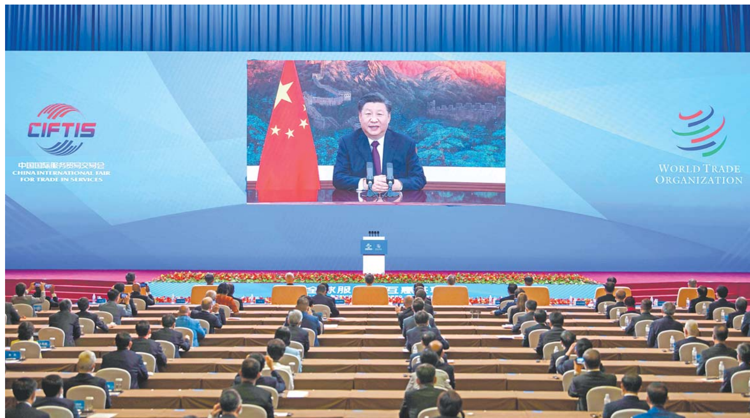
9月4日,国家主席习近平在2020年中国国际服务贸易交易会全球服务贸易峰会上致辞。

新华社北京9月4日电 国家主席习近平4日在2020年中国国际服务贸易交易会全球服务贸易峰会上致辞。