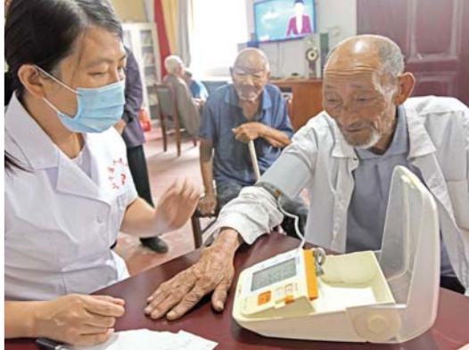
□ 记者 张环泽 通讯员 刘明祥 报道

8月26日，枣庄市山亭区人民医院4名医生组成爱心义诊小分队走进水泉镇福利院，义务为孤寡老人免费体检、赠送部分药品，并讲解老年常见病、多发病以及自我保健等知识，为老人们献上一份健康厚礼。