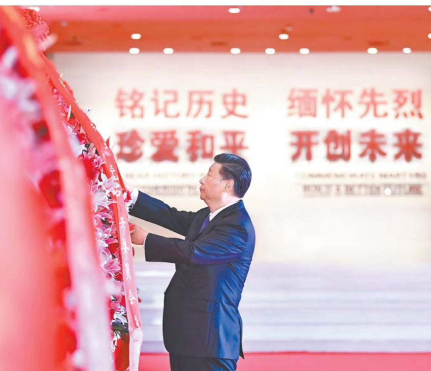
九月三日上午，习近平、李克强、栗战书、汪洋、王沪宁、赵乐际、韩正、王岐山等党和国家领导人来到中国人民抗日战争纪念馆，出席向抗战烈士敬献花篮仪式。这是习近平整理花篮上的缎带。