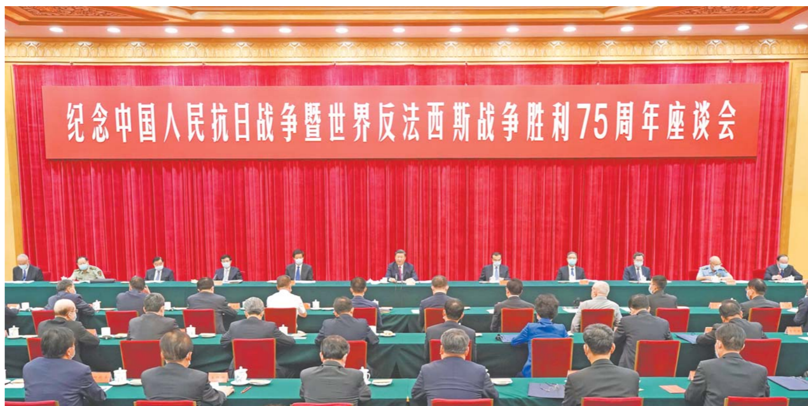
9月3日下午，中共中央、国务院、中央军委在北京人民大会堂举行座谈会，纪念中国人民抗日战争暨世界反法西斯战争胜利75周年。中共中央总书记、国家主席、中央军委主席习近平出席座谈会并发表重要讲话。

●实现中华民族伟大复兴，必须坚持中国共产党领导，必须坚持走中国特色社会主义道路，必须坚持坚持以人民为中心，必须坚持斗争精神，必须坚定不移走和平发展道路。任何人任何势力企图歪曲中国共产党的历史、丑化中国共产党的性质和宗旨，中国人民都绝不答应！任何人任何势力企图歪曲和改变中国特色社会主义道路、否定和丑化中国人民建设社会主义的伟大成就，中国人民都绝不答应！任何人任何势力企图把中国共产党和中国人民割裂开来、对立起来，中国人民都绝不答应！任何人任何势力企图通过霸凌手段把他们的意志强加给中国、改变中国的前进方向、阻挠中国人民创造自己美好生活的努力，中国人民都绝不答应！任何人任何势力企图破坏中国人民的和平生活和发展权利、破坏中国人民同其他国家人民的交流合作、破坏人类和平与发展的崇高事业，中国人民都绝不答应！