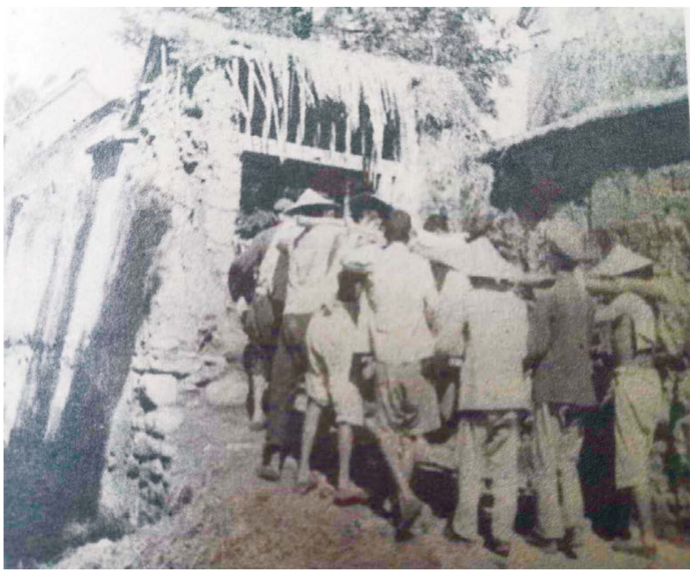
程家庄“大众日报通讯研究班”门口，老乡们帮助抬运设备。