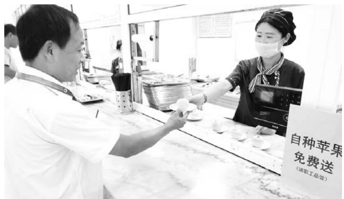
近日,在山东能源临矿彭庄煤矿矿区内,志愿者新版照料的水果树已硕果盈枝,采摘后的苹果供职工免费品尝,成为一道脍炙人口的“福利水果”。(郭浩 王泉麟)

与此同时,李楼煤业党委还精心选拔部分“技术能手”“创新达人”等专业技术人员,走进区队、车间以及井下生产现场,把专题培训课程送到岗位上,不断提高全员的综合素养和实践能力,引领大家将学到的理论知识,以最快、最直接的方式转化为生产力,坚定不移地向实现矿井高质量发展迈进。