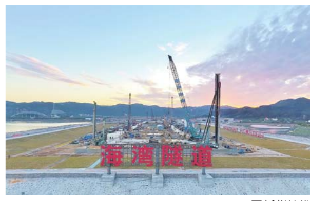
8月7日，由中信集团投资、中铁隧道局设计施工总承包的国内最大直径越海盾构隧道——汕头海湾隧道西线贯通。

据新华社天津8月7日电 天文专家介绍，8月9日，火星这颗备受关注的行星将与月球上演“相合”的精彩戏码。届时，如果天气晴好，公众可以用肉眼看到红色的火星与皎洁的月亮相互辉映，齐放光芒的美丽画面。 火星是地球轨道以外的第一颗行星，颜色呈红色，由于亮度变化大，在我国古代被称为“荧惑”。 中国天文学会会员、天津市天文学会理事史志成介绍说，进入8月，火星一天比一天明亮，升起的时间也提前到了21时50分左右，日出时位于西南方天空，亮度约-1.4等，后半夜观测条件不错。 8月9日22时以后，火星携着月亮从东方升起，随着时间推移，逐渐升高，子夜时分位于东南方天空，次日凌晨4时左右，运行至正南方天空。这段时间内，人们将会看到一轮凸月，其凸面朝向东方。在月亮左方不远处，有一颗红色的星星，闪闪发光，这就是火星。