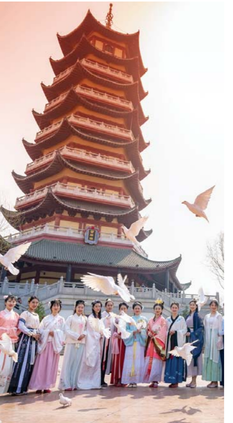
▲按下“重启键”，济南文旅市场逐渐复苏回暖。济南方特东方神画举办的“华服节”古韵十足。图为汉服爱好者合影留念。

7月12日至14日，济南市代表团赴浙江省杭州市、宁波市、嘉兴市，围绕加快打造“五个济南”进行学习考察、招商引资。