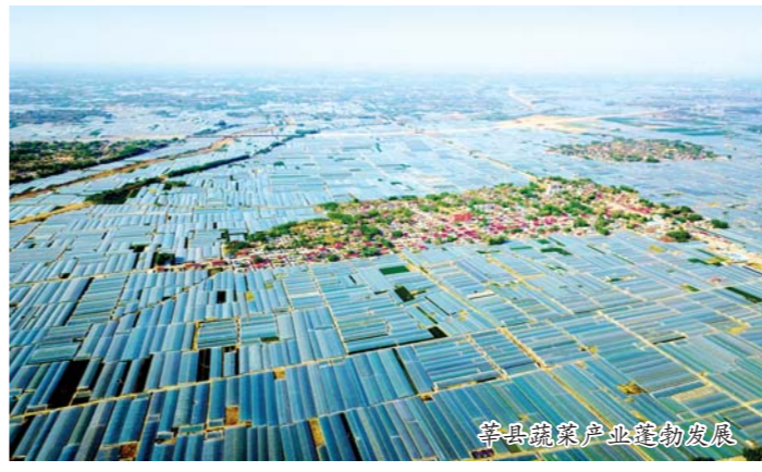
莘县蔬菜产业蓬勃发展

第二届江北水城“双招双引”大会于7月31日—8月1日在聊城阿尔卡迪亚酒店举行。大会以“聚焦区位优势·聚力水城新发展”为主题，旨在更大范围、更高水平推进招商引资、招才引智，打造对外开放新高地，助力聊城新旧动能转换重大工程，加快聊城高质量发展，实现在全省争创一流、走在前列，在鲁西大地率先崛起。