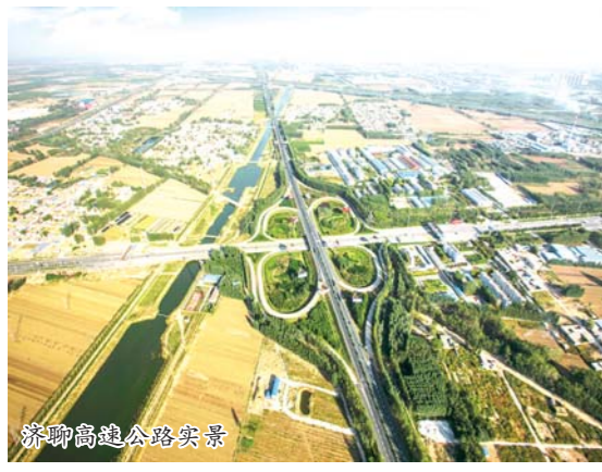
济聊高速公路实景