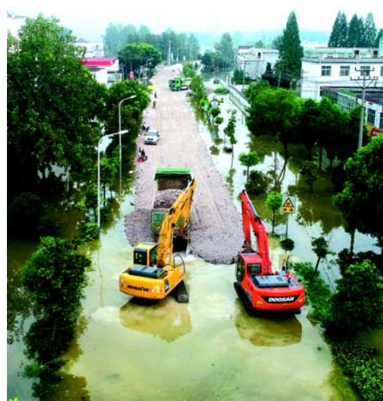
7月29日，安徽省巢湖市夏阁镇境内G329国道，大型机械在漫水路段抢修(无人机照片)。