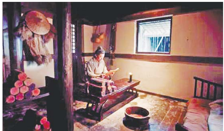
电视纪录片《颜子》在跨越时空的对比中，带您从颜回身上找到中国知识分子身上不计事功、专意追求道德理想和真理的“原儒”精神。