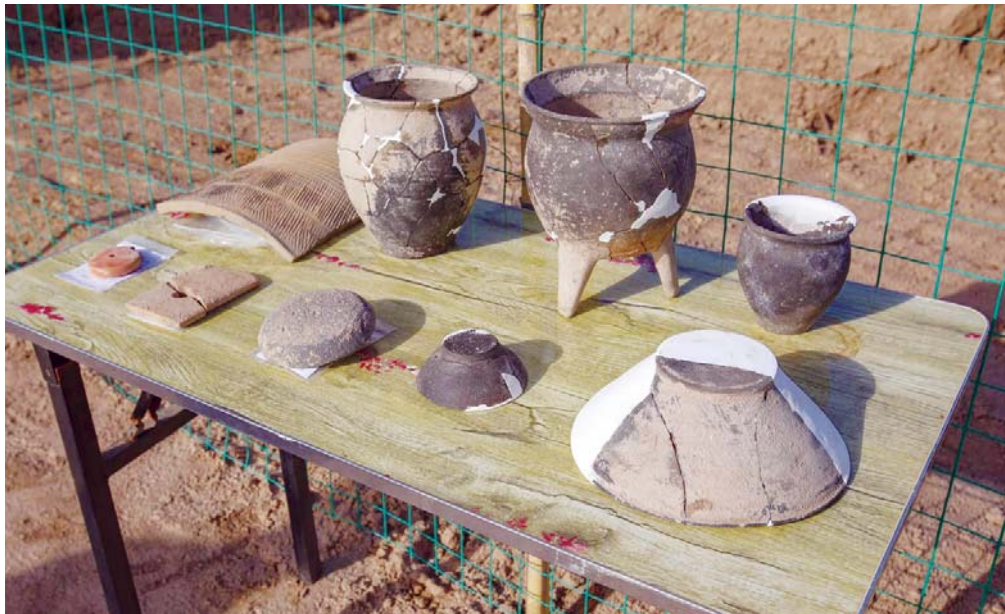
北营遗址出土的龙山文化遗存。