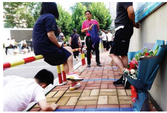
一名带着鲜花在考场外等待的家长, 疲惫地斜靠在护栏上, 等着考生走出考场。