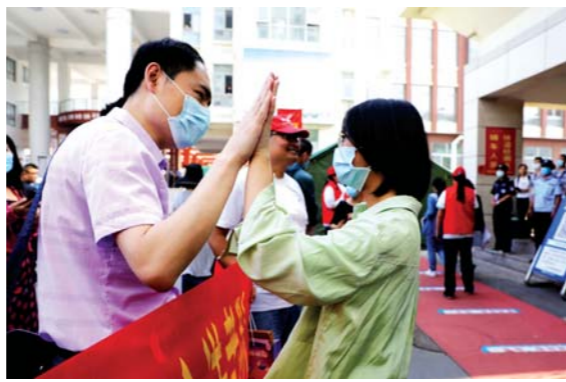
7月7日, 临沂市兰山区临沂二中考点, 老师(左)同即将走进考场的考生击掌加油。