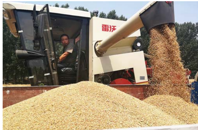
往年在外为他人收割, 如今在自己的家庭农场收麦, “麦客”实现了“华丽”转身。