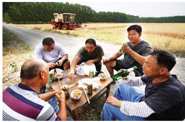
当年四处奔波的“麦客”而今在自己的农场里劳作, 田间小饮, 其乐融融。