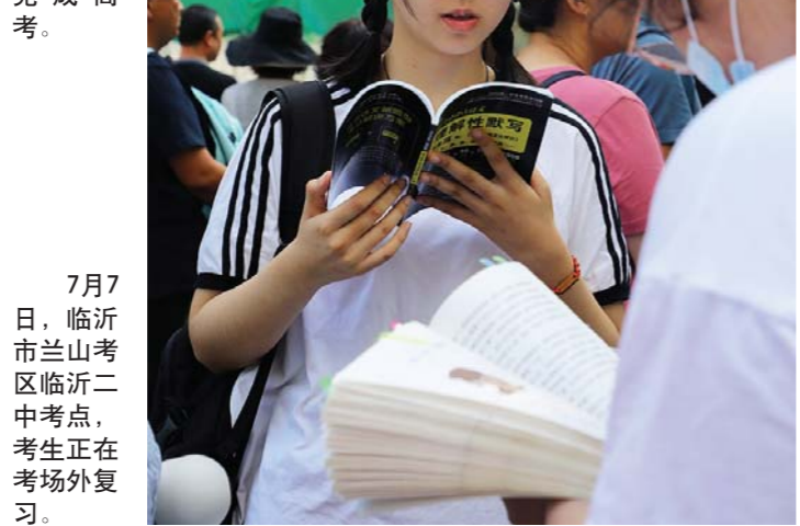
7月7日, 临沂市兰山区临沂二中考点, 考生正在考场外复习。