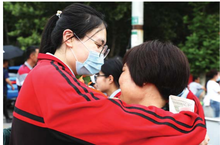
7月9日, 临沂市沂南考区卧龙学校考点, 一名考生热情拥抱迎接她的家长。选择当天三门学科考试的考生, 提前完成高考。

凡是过往, 皆为序章。我们不但挺住了, 而且我们胜利了。唯愿考生取得应有成绩, 向着梦想, 再次出发。