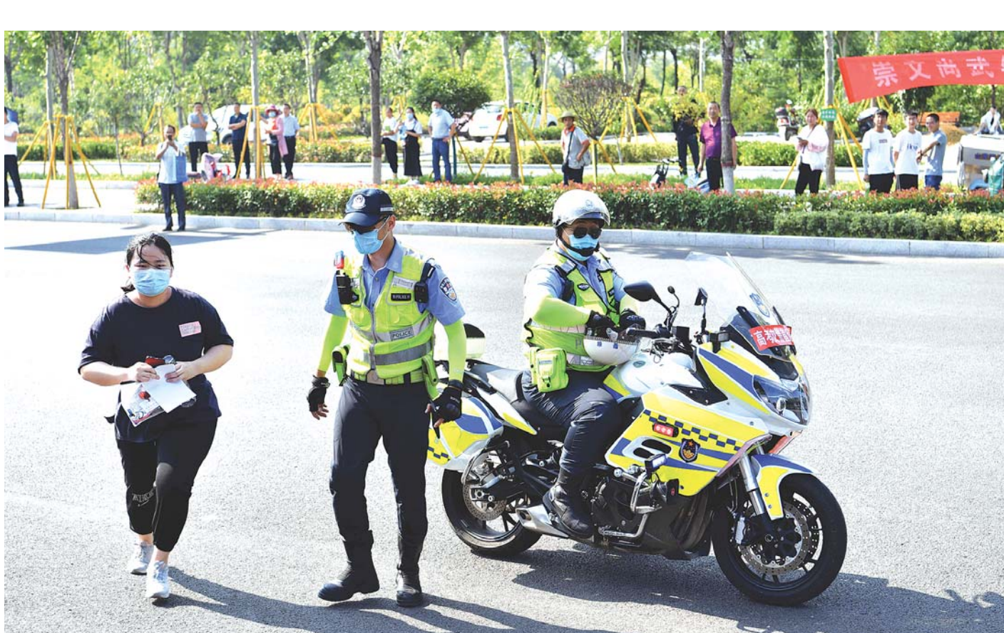
7月7日，高考开始。枣庄市公安局山亭分局成立护考服务小分队，针对可能出现的考生身份证遗失、赴考时间延误等意外情况，做好应急服务，确保考生如期参考。

据介绍，目前，枣庄全市不动产登记实现了即时办结一批：不动产查封、解押、地址变更、更名变更、异议等一般登记业务；1日办结一批：非涉税抵押登记业务（不含需要税务部门转办的业务，不含在建工程抵押），涉及转移、抵押联办但已提前完成缴税的业务；3日内办结一批：除非公证继承的转移登记及政府统一组织的不动产登记之外的其他业务。