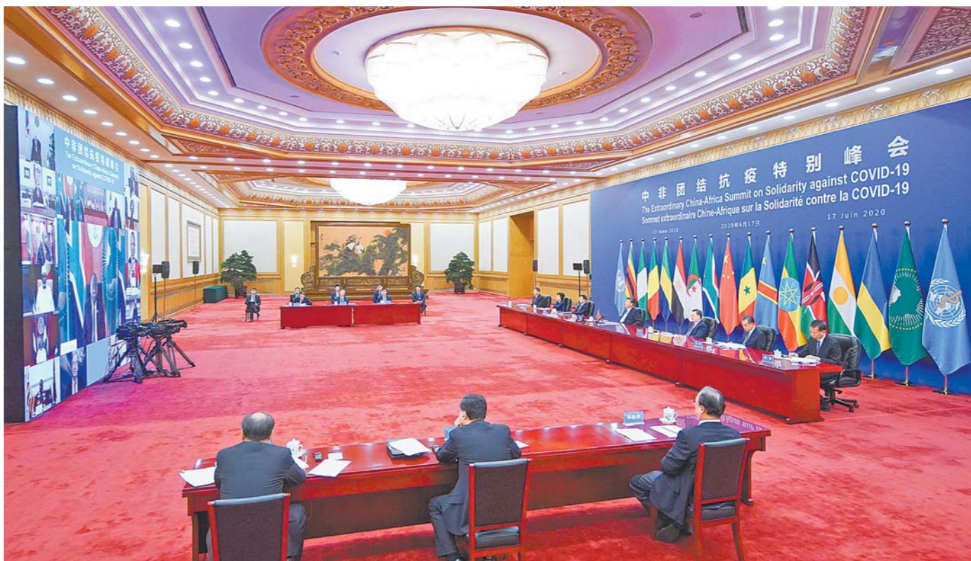
6月17日晚，国家主席习近平在北京主持中非团结抗疫特别峰会并发表题为《团结抗疫 共克时艰》的主旨讲话。