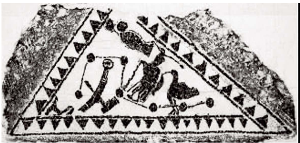
▲滕州出土的三角形北斗星画像石。石上刻北斗，顶部出现一条大鱼。

常充当天帝的标志。美国汉学家班大为认为“帝”是天象星图，即公元前2150年前后北天极位置的星图。