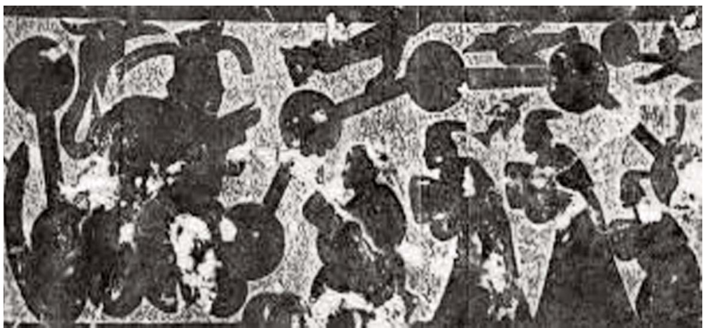
▲嘉祥武梁祠中前石室屋顶前坡西段后壁上刻画的一个巨大的北斗。