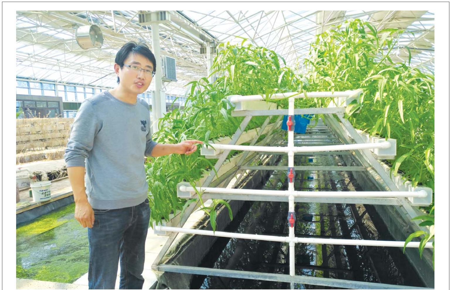
□ 记者 宋学宝 通讯员 王鲁兵 报道

此外，据王金祥介绍，会计领军人才在助力企业业务创新、推动并购上市、降低管理成本、化解发展风险等方面，发挥着日益重要的作用。前期，潍坊市财政局在全省率先将会计人才纳入潍坊市委组织部的全市人才专家库，首批入库人员30名，让会计人才在经济社会中的地位进一步凸显。