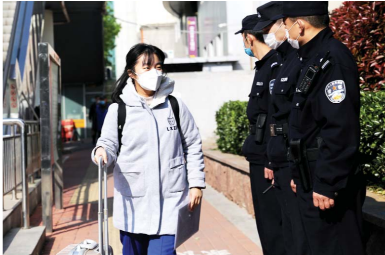
省实验中学门外, 一位报到的学生好奇地打量着路边值守的民警。当天, 公安交警等相关部门全力保障开学安全有序。