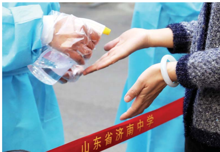
济南中学, 教职员工正在演练集中取运午餐前用酒精为双手消毒。