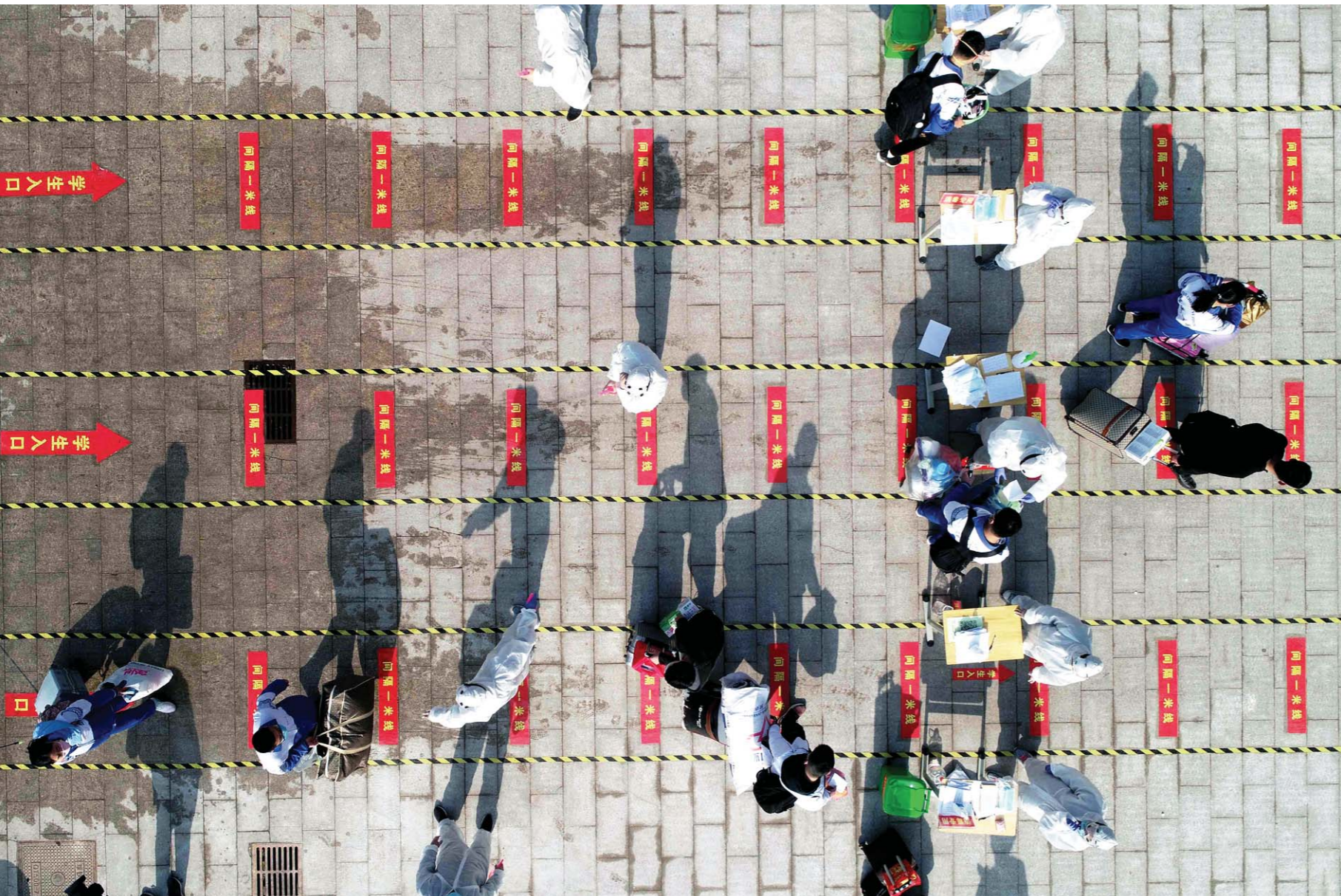
4月15日, 临沂市郯城第一中学, 工作人员引导高三学生进行身份验证、体温检测, 学生们严格保持间距, 有序行进。