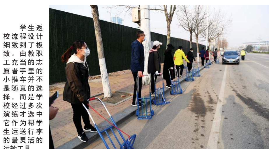
学生返校流程设计细致到了极致。由教职工充当的志愿者手里不是随意的小推车, 而是学校经过多次演练才选中它作为帮学生运送行李的最灵活的运输工具。