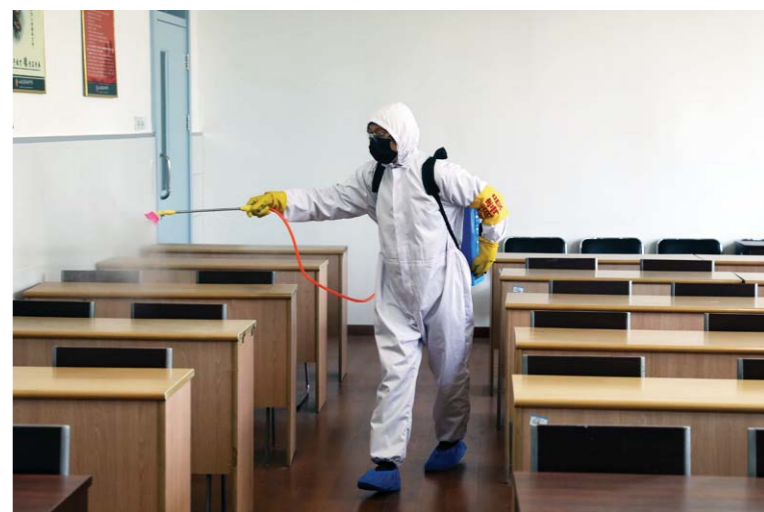
4月14日, 济南中学, 工作人员对教室进行全面喷施消杀作业。