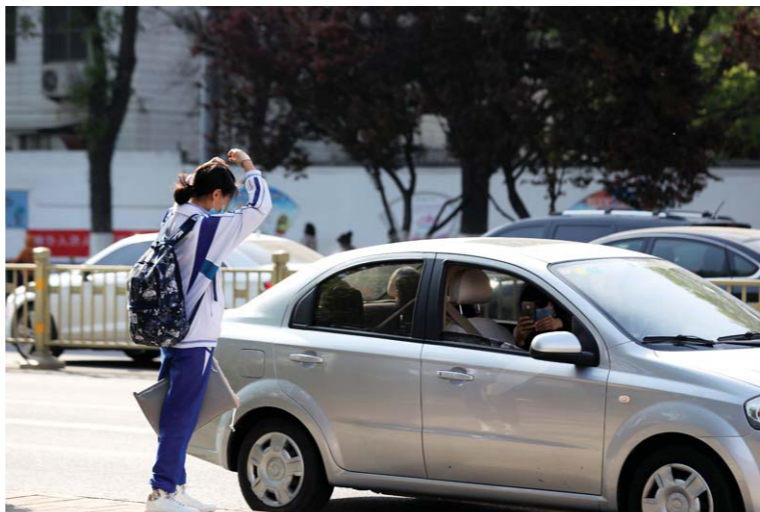
省实验中学门前道路上, 一名学生告别开车的家长, 催促她赶快离开、不要停留。