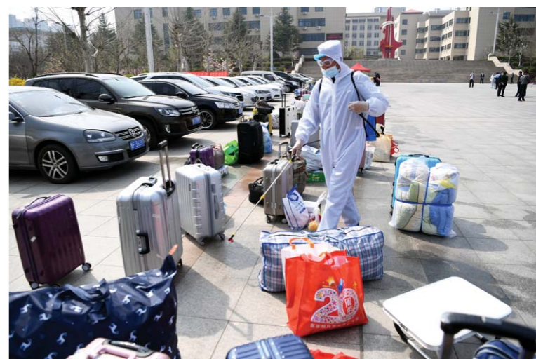
学生入校过程中, 人和行李走的是两条不同的防疫通道, 进入学校的行李还要经过一次细致的消毒。