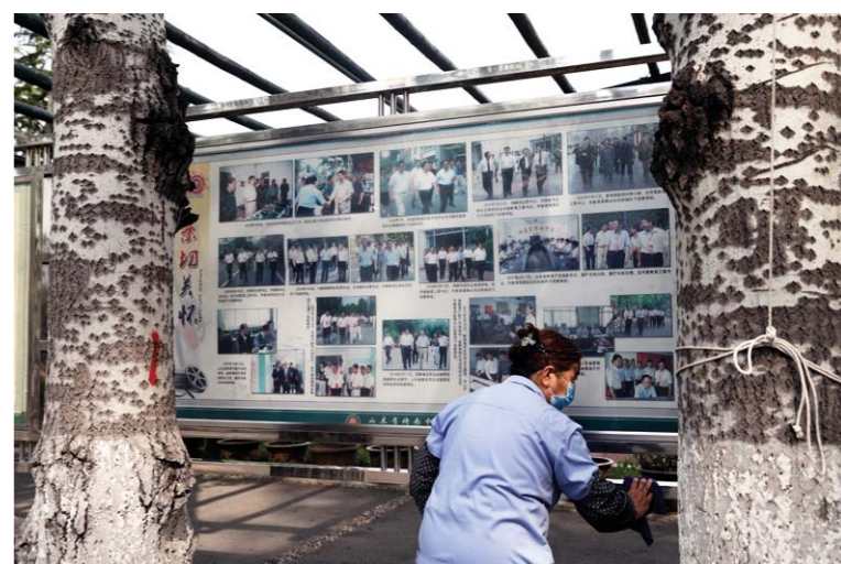
济南中学保洁人员在仔细擦拭校园宣传栏。整个校园进行了高三开学前最后一次大扫除。