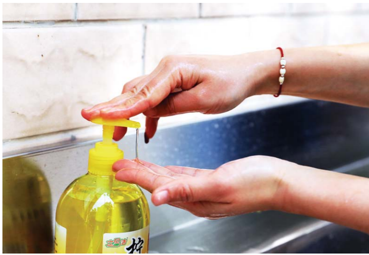
4月14日, 济南中学, 厕所外的盥洗池, 参加演练的教职员工使用洗手液洗手。