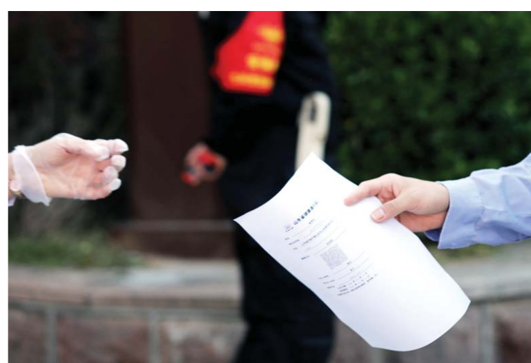
4月15日, 山东省实验中学, 教师戴着一次性手套, 接过报到学生递来的纸质材料。