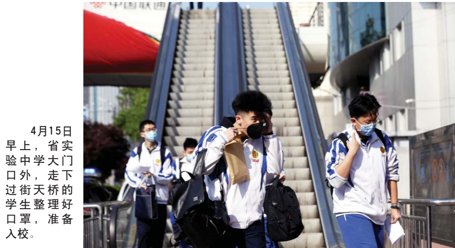
4月15日 早上, 省实验中学大门口外, 走下过街天桥的学生整理好口罩, 准备入校。

据统计, 作为教育大省, 山东现有各级各类学校3.77万所, 在校生1900多万人, 教职工150多万人。高三顺利开学后, 其他年级、学校将按步骤计划, 有序开学复课。