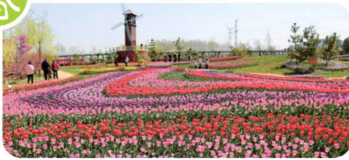
左上：常山景区 右上：范公亭公园 左下：东营市河口区鸣翠湖景区 右下：枣庄莲花山生态园