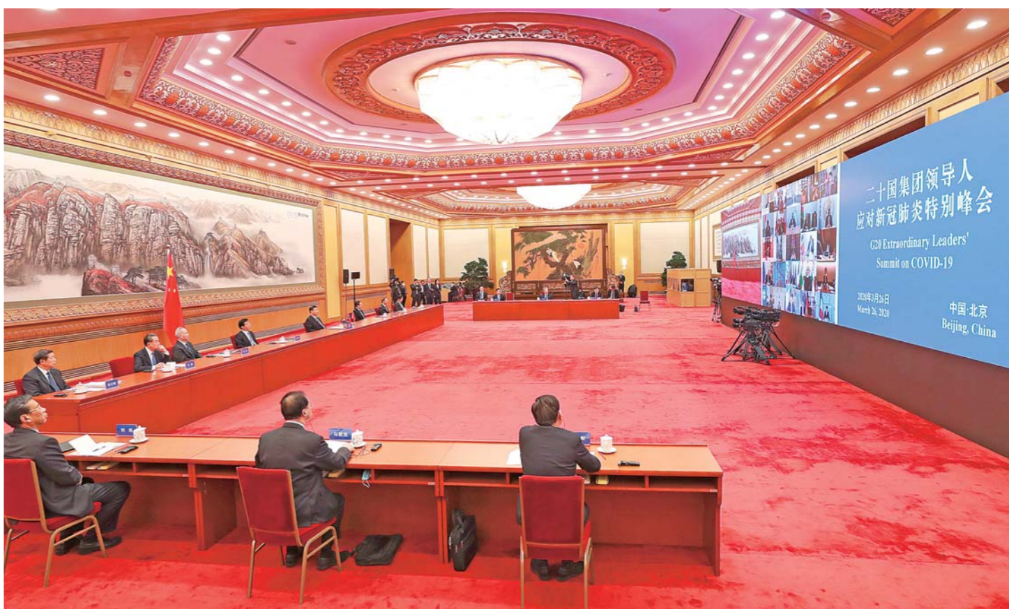
3月26日，国家主席习近平在北京出席二十国集团领导人应对新冠肺炎特别峰会并发表题为《携手抗疫 共克时艰》的重要讲话。