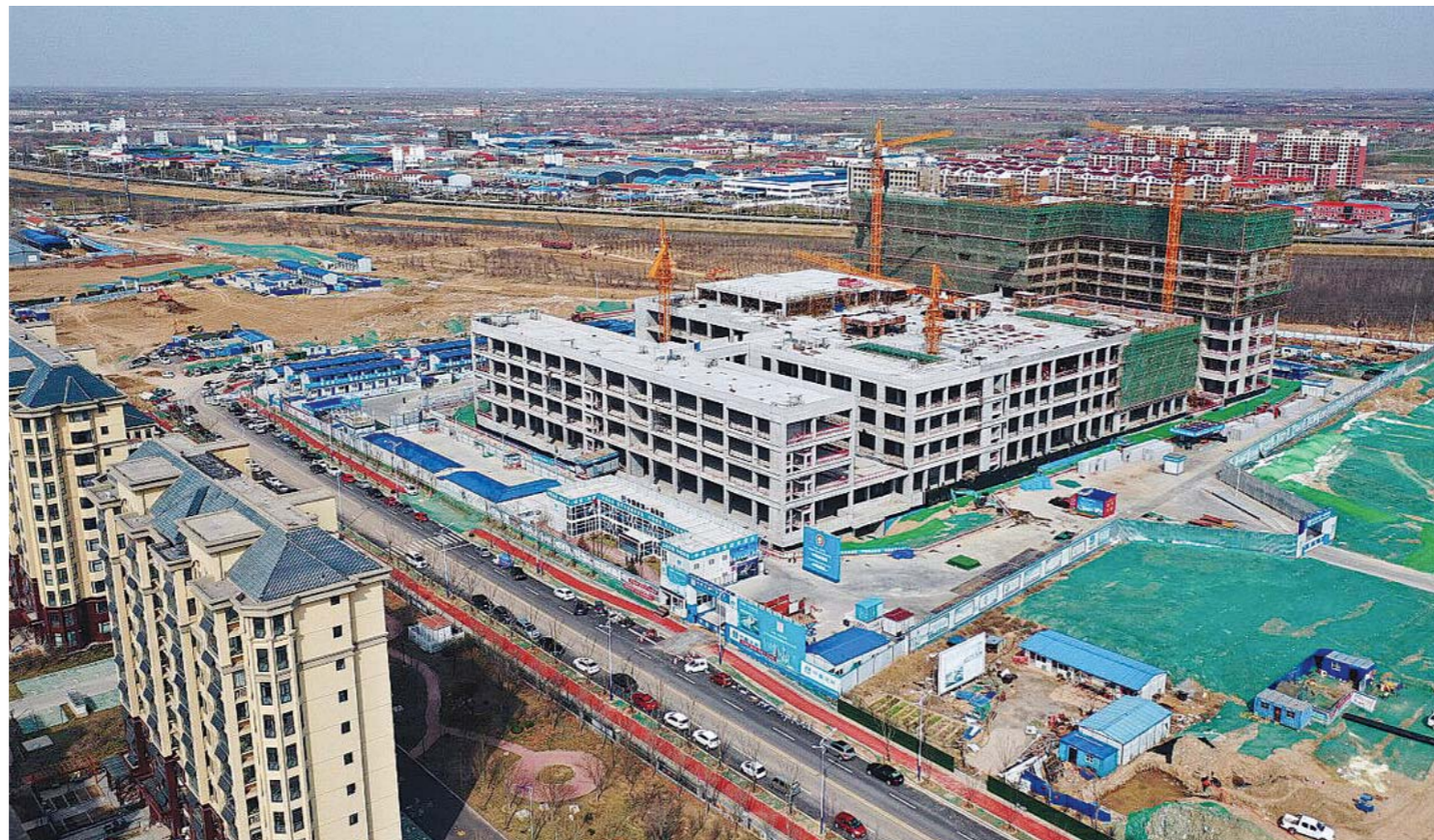
滨州市中医医院建设工地现场。