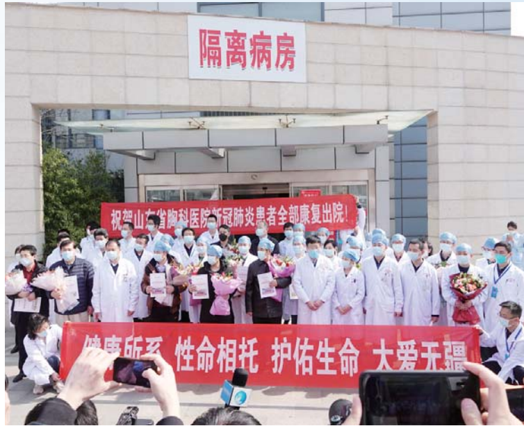
▲3月16日，山东省胸科医院收治本土新冠肺炎患者全部清零

写在前面：庚子鼠年伊始，突如其来的新冠肺炎疫情打乱了人们生活的节奏。疫情就是命令，防控就是责任。在这个特别的2020年之春，有这么一支精锐之师叫胸医人，他们闻令而动，在抗疫的硝烟中驱散病魔，用生命诠释初心使命，弘扬胸医精神；他们遏制结核病的流行，斩断新冠病毒的传播链条，其前瞻布局 and 先进防控救治理念和行动，赢得了阶段性胜利，为山东省和全国疫情防控作出积极贡献。